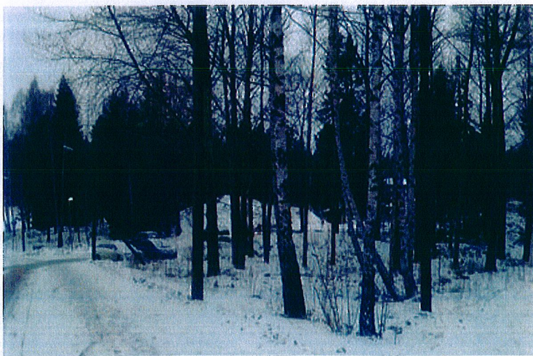
Markområdet mellan parkeringen och gångvägen, där den utökade parkeringen kan bli aktuell, sedd från öster

Planområdet är beläget vid Dalskolans parkering, intill skogsmarken i Wättinge parkstråk. Marken är redan idag till största delen ianspråktagen för komplementbyggnaderna samt befintlig parkering.