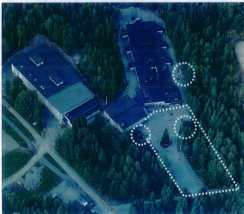
Det större förrådet (ovan th), miljöhuset (nedan th) och det mindre förrådet (tv), samt parkeringsytan, sett från söder

2014-01-15 fick samhällsbyggnadsförvaltningen i uppdrag av kommunstyrelsens miljö- och samhällsbyggnadsutskott att ta fram en ny detaljplan för Dalskolans komplementbyggnader och parkering med normalt förfarande.