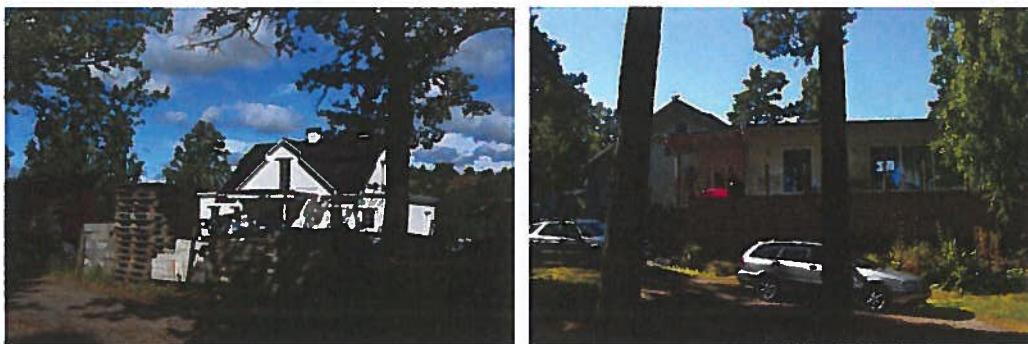
Figur 3: Byggnader som uppförts med stöd av befintliga byggnadsplaner

Detta kan jämföras med byggnadsplanerna för I3 där en huvudbyggnad om 150 kvm BYA får upprättas samt vind inredas. Att vind får inredas bedöms motsvara övervåning då inte taklutning eller byggnadshöjd begränsas i byggnadsplanen. Att vind får inredas kan ge en vind om 150 kvm varav, beroende på utformning, ca 70 kvm räknas som BTA. Detta ger en huvudbyggnad om ca 220 kvm BTA. Källare får anordnas och komplementbyggnad får uppföras om 40 kvm.