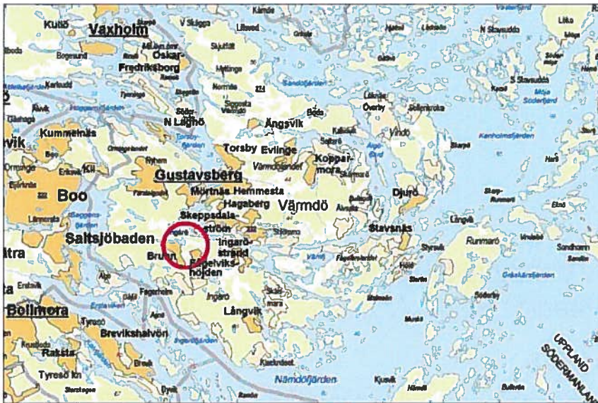
Figur 1: Översiktskarta. Ingarö I3, geografiska placering