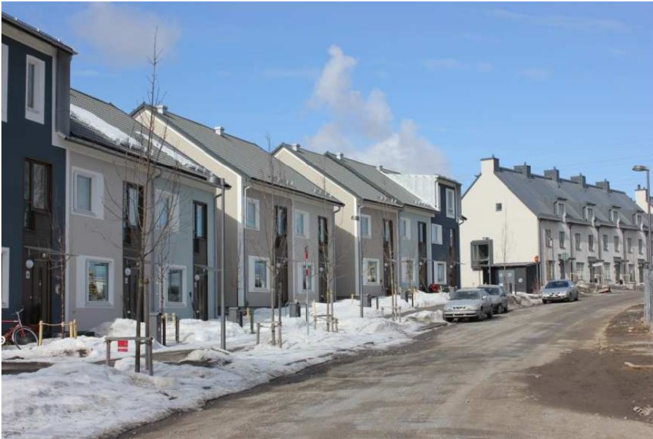
Del av bebyggelsen i etapp 1 vid Maria Röhl's väg

Planområdet har kort avstånd till en låg- och mellanstadieskola vid Sandåkravägen och livsmedelsbutiker i Sköndals centrum och Norra Sköndal. Busslinje 181 som går efter Sandåkravägen ansluter till två tunnelbanelinjer samt pendeltåg. En busslinga planeras genom den nya bebyggelsen. Tyresövägen trafikeras av direktbussar mot city och Tyresö.