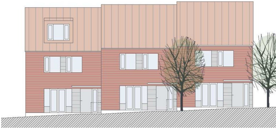
Illustration av radhus (Illustration Brunnberg & Forshed)

En stor del av området består av enfamiljshus i form av radhus, kedjehus och friliggande villor. Radhusen planeras i åtta små grupper, främst kring Byängen men också utmed Stora Sköndals väg och en central gata längre söderut i planområdet. De utformas i två våningar och en inredningsbar vind. Radhusen är tänka att utformas med ett branta sadeltak som förskjuts närmare gatan och ger möjlighet till takkupor för den som vill.