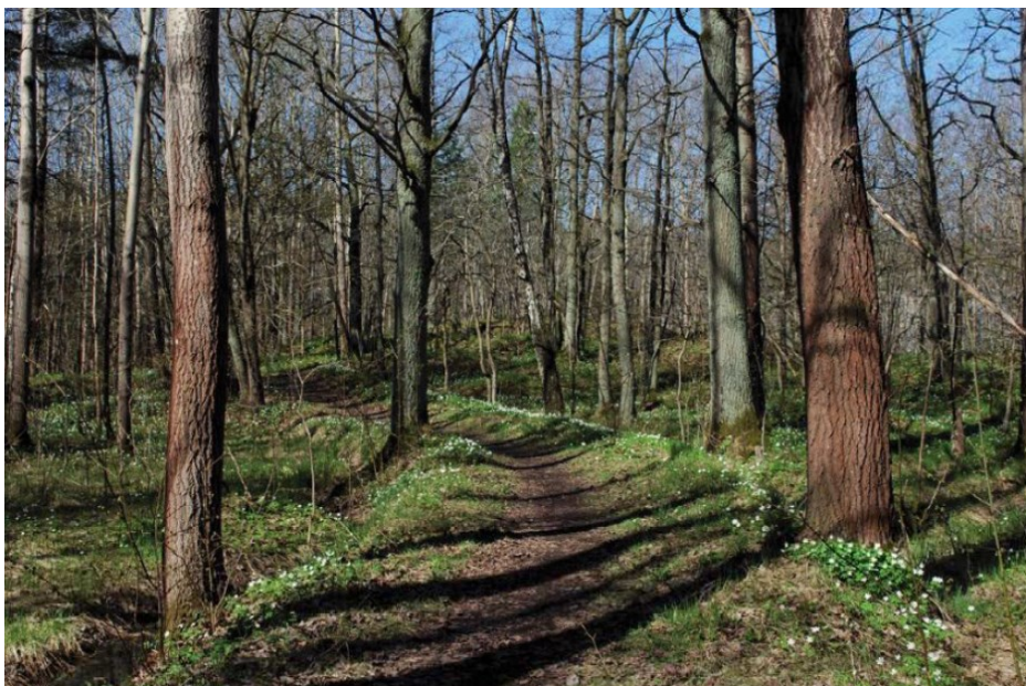
Den gamla Forvägen bevaras som promenadstig mellan Byängen och Flatens

Det nya bostadsområdet bedöms enligt miljökonsekvensbeskrivningen innebära en förbättring av miljön som helhet, då störande verksamheter och skräpiga upplag längs Stora Sköndals väg försvinner och ersätts av bostäder. De föroreningar som finns i marken kommer delvis att schaktas bort och ny matjord att tillföras. Det bedöms innebära en positiv påverkan på miljön med avseende på såväl mark som vatten. Lösningarna ger en bra dagvattenhantering och mängderna av ämnen som transporteras via grundvatten till Flaten och Drevviken kommer att minska i och med att den totala mängden föroreningar i marken kommer att minska.