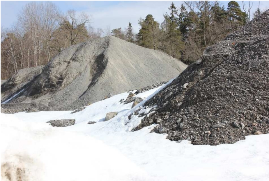
Planområdet har använts för masshantering. I bakgrunden syns träd i Flatens naturreservat.

På senare tid har olika verksamheter av industrikaraktär funnits i området med stöd av tidsbegränsade lov. I samband med utbyggnaden av Södra Länken användes området för en krossanläggning som nu är avvecklad. Intill Flatenvägen finns en bensinstation med tidsbegränsat lov som gick ut 2004. Bensinstationen kommer att tas bort när planen genomförs. De delar av utfyllnadsområdet som inte använts har delvis vuxit igen. Mer naturlig vegetation finns på några kullar där hållmarken sticker upp och omges av morän. På dessa kullar växer ekar och en del stora tallar. Inga naturskyddsformer finns inom planområdet.