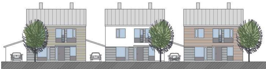
Illustration av kedjehusen (Brunnberg & Forshed)

Kedjehusen är placerade i de fem kvarter mitt i planområdet. De ligger med långsidan mot gatan för att skapa tydliga stadsrum. Tomterna kommer att odlas upp och bli gröna trädgårdar. Mellan husen finns förråd och biluppställning.