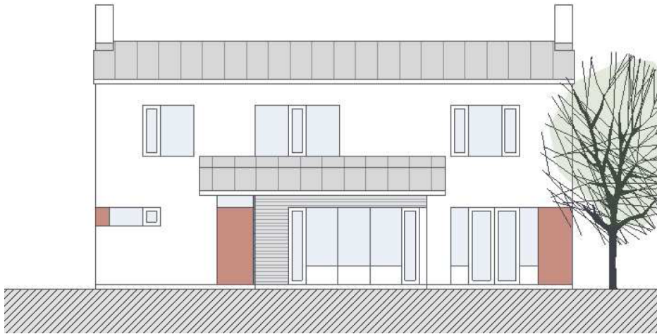
Illustration av villa sedd från sidan (Brunnberg & Forshed)

Planområdet markeras tydligt mot Tyresövägen genom ett långt och ett kortare femvåningshus som inramar infarten till området från Sandåkravägen. De båda byggnaderna får förhöjda partier som kan upplevas som en port vid infartsgatan. Den långa byggnaden föreslås av Skanska få delvis inglasade loftgångar mot Tyresövägen med en lekfull och varierad utformning för att undvika ett monotont och storskaligt intryck. På andra sidan huset i söder får de genomgående lägenheterna rymliga balkonger.