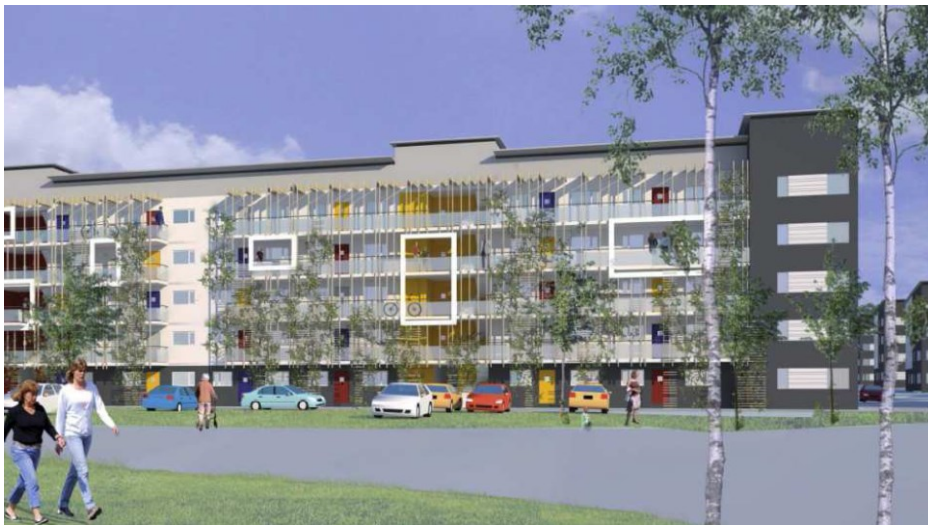
Illustration av flerbostadshuset närmast Flatenvägen (Plan- och Byggnadskonst i Lund AB)

Planområdet markeras tydligt mot Tyresövägen genom ett långt och ett kortare femvåningshus som inramar infarten till området från Sandåkravägen. De båda byggnaderna får förhöjda partier som kan upplevas som en port vid infartsgatan. Den långa byggnaden föreslås av Skanska få delvis inglasade loftgångar mot Tyresövägen med en lekfull och varierad utformning för att undvika ett monotont och storskaligt intryck. På andra sidan huset i söder får de genomgående lägenheterna rymliga balkonger.