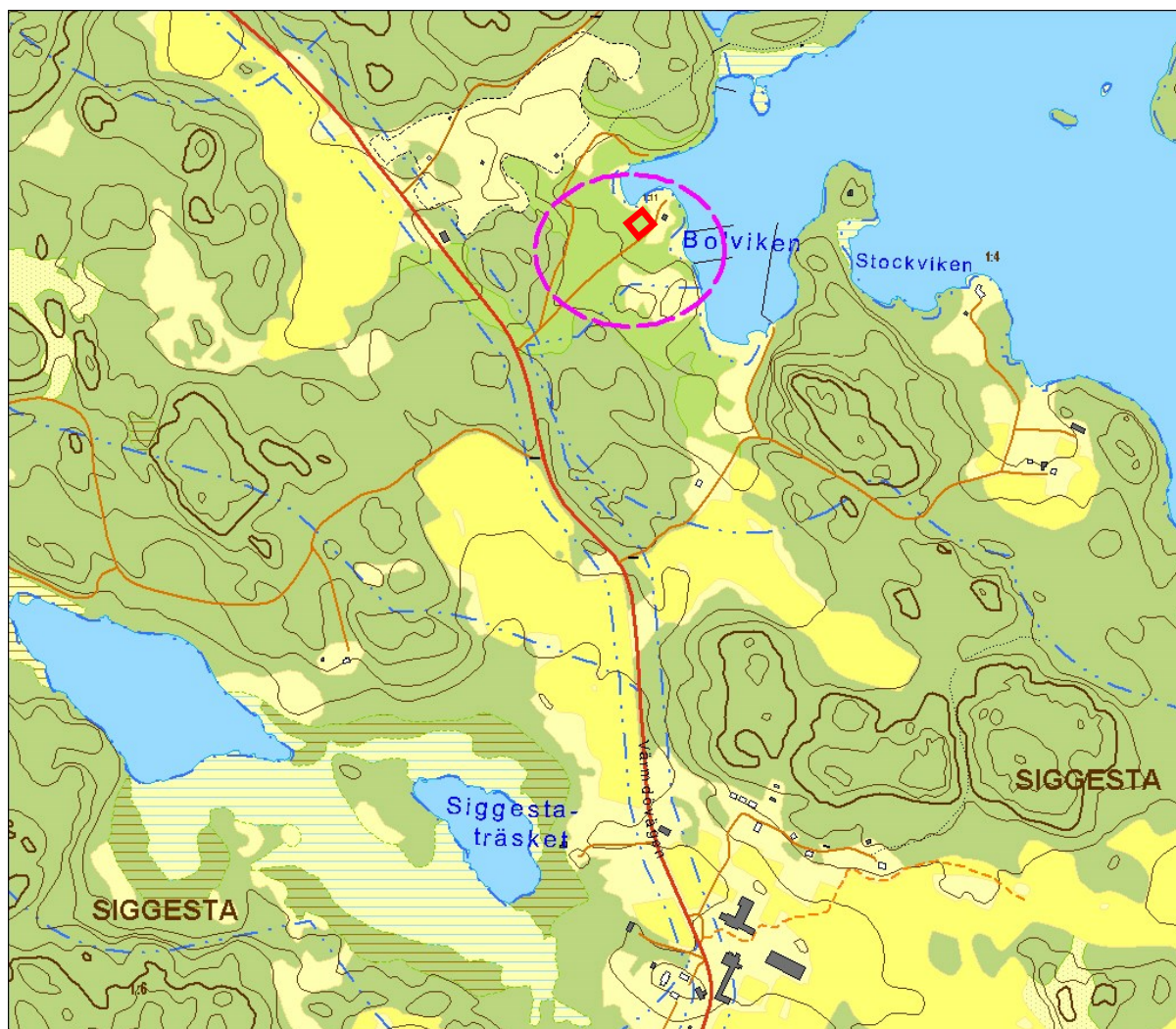
Karta: Området kring Bolviken med planområdet markerat med röd ram.