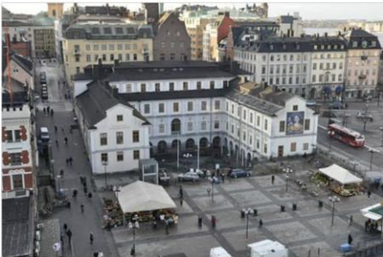
Södra stadshuset vid Ryssgården

Den 2013-06-18 fattade fastighetsnämnden och kulturnämnden ett inriktningsbeslut varefter programarbete startades och program- och systemhandlingar arbetats fram.