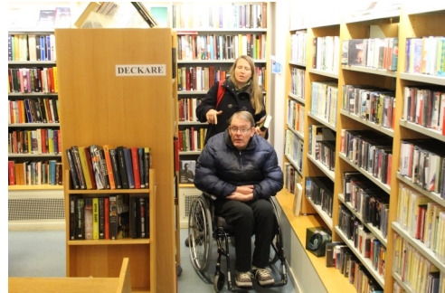
Sittande i rullstol har svårt att se de övre hyllorna i biblioteket