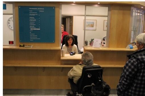
Mycket bra receptionsdisk i vårdcentralen, sänkbar och lätt att nå t.ex. kortbetalare