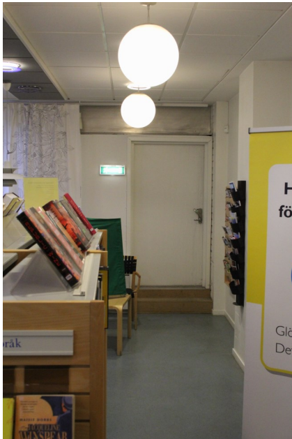
Reservutgången i biblioteket omöjlig att använda för rullstolsbunden och svår för barnvagn och rullator.