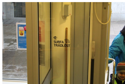
Trådlösa nätverk gör livet betydligt svårare för många elöverkänsliga