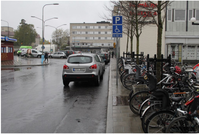
Cykelparkeringen hindrar funktionsanpassad bil med ramp åt sidan