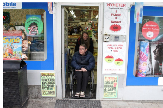
Dörrar, utan automatik, som öppnar inåt är svåra för rullstolsbundna m.fl. eftersom man inte når att öppna dörren