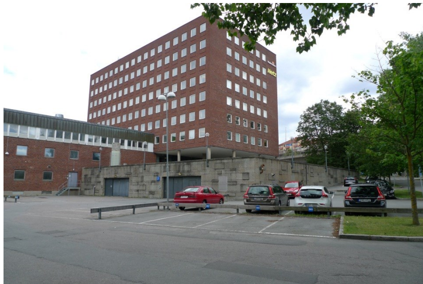
Låg- och högdal samt terrassmur.