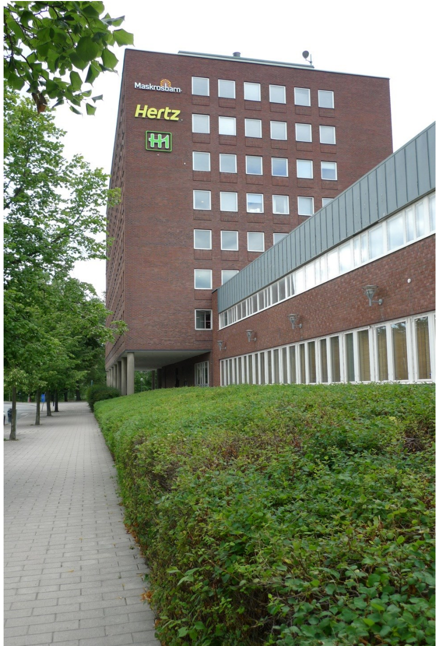
Bacho:s lager- och kontorsbyggnad med hög- och lågdel. Högdelen vilar på pyloner.