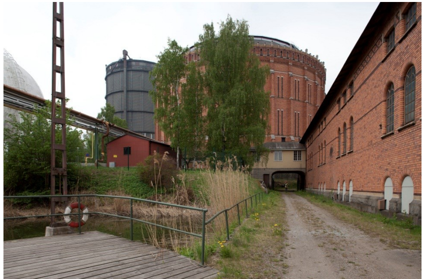
Platsen för den föreslagna nybyggnaden F.

Gasklocka 4 på bilden kommer att rivas enligt en tidigare plan. Illustration ur samrådshandlingarna