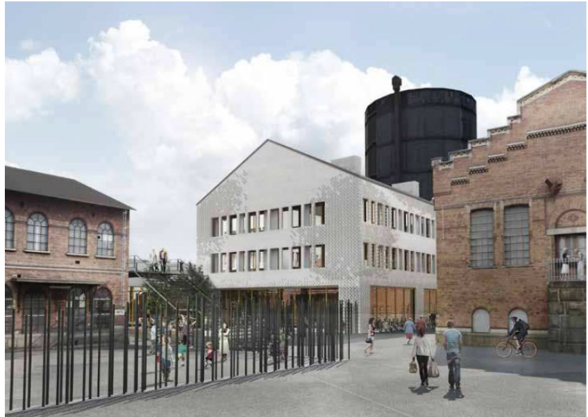
PERSPEKTIV från aktivitetstorget mot nedre skolgården och trappkopplingen till övre nivån. Byggnader, från vänster: hus 13, sockelväning G, hus F och hus 10

Nybyggnaden, trapparrangemang och skolgård gör ett stort intrång i området och skärmar av den centralplatsen från upplevelsen av gasklockorna.