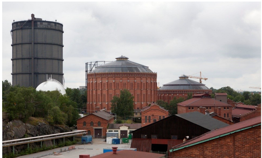
De planerade nybyggnaderna kommer att ligga framför den klotrunda gasklockan samt i bildens mitt framför tegelgasklocka 2.

Samtliga befintliga byggnader får skyddsbestämmelser som i huvudsak är bra men ytterligare behöver bearbetas för att på sikt säkerställa byggnadernas kulturhistoriska värden. Skyddsbestämmelser finns också för marken men en stor del undantas intill de planerade nybyggnaderna. Bestämmelserna bör utökas med en högre detaljeringsgrad och omfatta hela markområdet. Utformningen och bestämmelserna för Klockparken behöver studeras vidare.