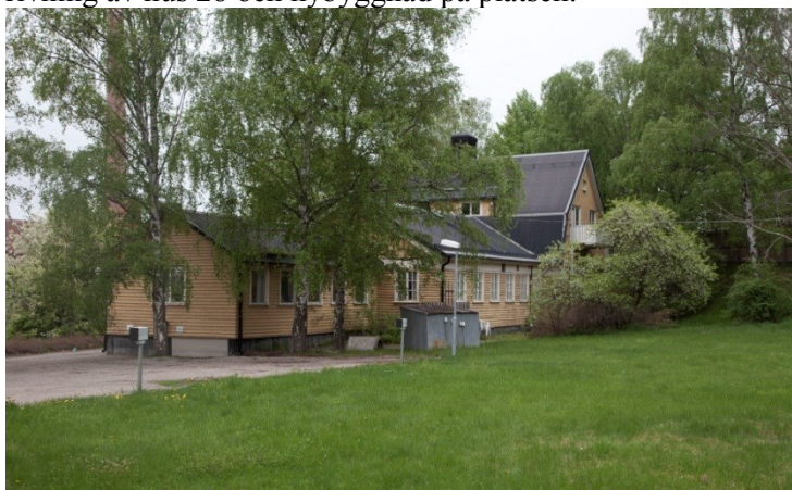
Hus 28 som rivs och ersätts av en nybyggnad.

Marketenteriet ersätts av en skolbyggnad i fyra våningar från Gasverksvägen och fem våningar från markplanet där hus 13 står och som är gasverksområdets marknivå. Byggnaden kommer att utgöra en mur och med sin ansefliga höjd skärma av gasverksområdet från Gasverksvägen vilket ger en negativ påverkan samt minskar områdets historiska läsbarhet och upplevelse. Förvaltningen avstyrker således rivning av hus 28 och nybyggnad på platsen.