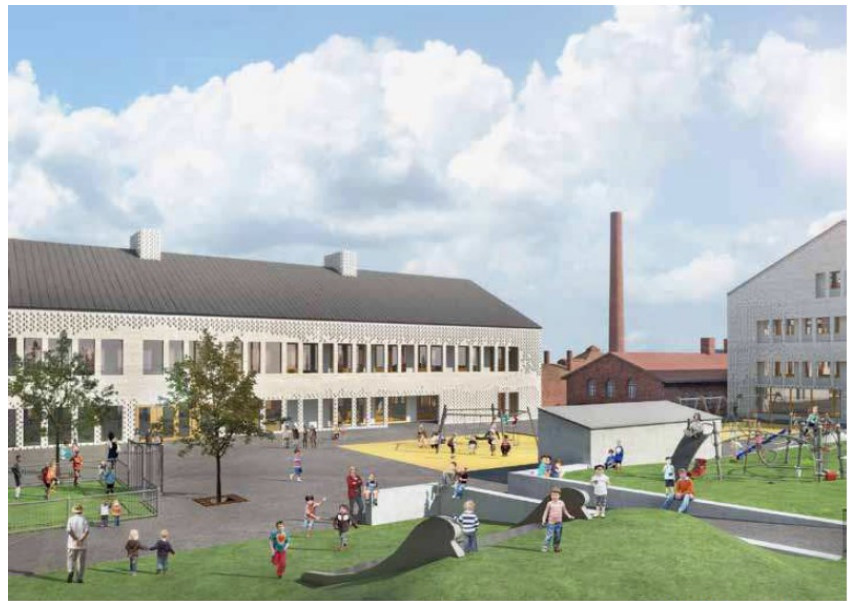
PERSPEKTIV övre skolgården

förändring av områdets karaktär. Det innebär också att anslutningen mellan den övre nivån vid Gasverksvägen och den nedre marknivån måste överbryggas med trapparrangemang och brokonstruktioner. Områdets tillgänglighet minskar. Byggnadens tak arrangeras som skolgård med för området synnerligen främmande arrangemang.