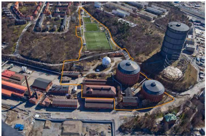
Planområdet markerad med gul linje. Överst i bild Hjorthagens IP. Illustration ur samrådshandlingarna

Stadens vision för Gasverket är att området både skall bidra till ett fungerande vardagsliv för boende och arbetande i Hjorthagen, med service omsorg, skola och mötesplatser för alla samt vara ett spännande besöksmål.