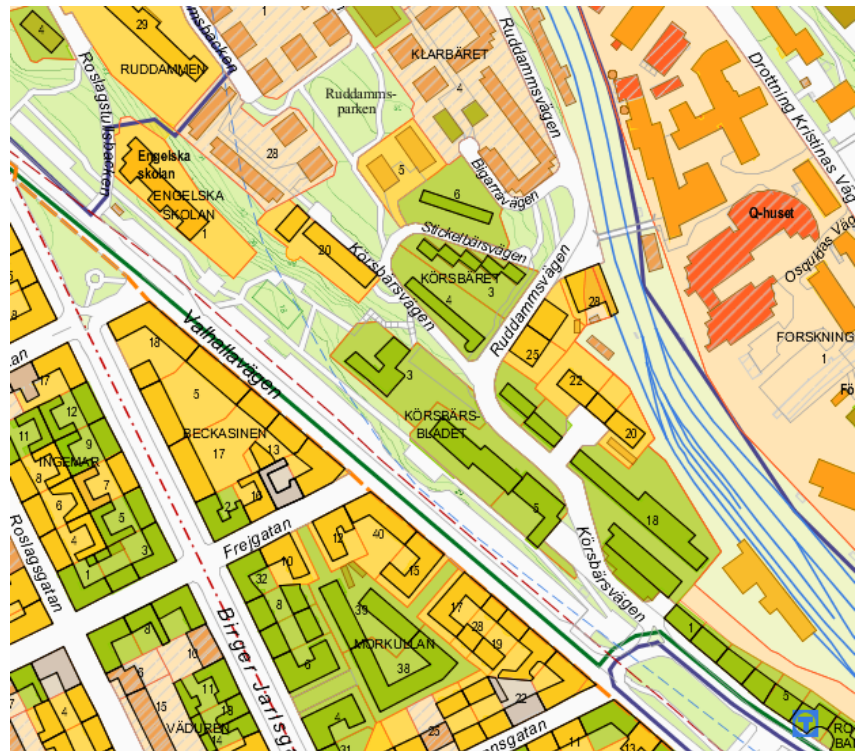
Stadsmuseets kulturhistoriska klassificering