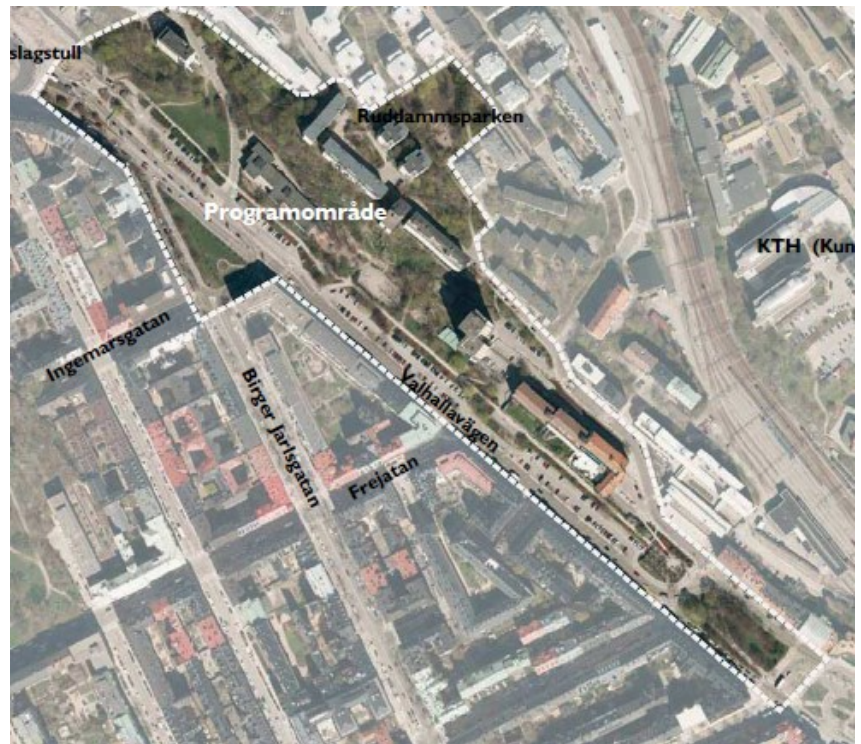
Programområdet. Illustration ur samrådshandlingarna