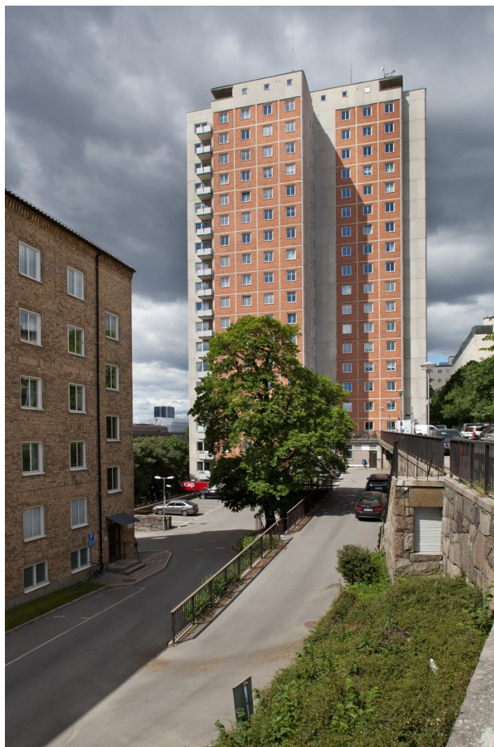
Kvarteret Körbärsbladet med Nyponet i fonden och Domus t.v.

Den föreslagna bebyggelsen intill höghuset, studenthemmet Nyponet anser förvaltningen som olämplig. Det 19 våningar höga studenthemmet uppfördes som ett komplement till den lägre byggnaden Domus, Stockholms första studenthem, i kvarteret Körbärsbladet. Domus byggdes 1952-53 och ritades av arkitekt Dag Ribbing och hade sammanlagt 263 studentrum med restaurang och andra serviceinrättningar. Höghuset Nyponet byggdes som ett komplement med ytterligare 277 studentrum och samlingsal m.m. ritat av samme arkitekt. Domus och Nyponet, är samkomponerad, hör samman och bör inte skiljas åt av nybebyggelse, särskilt inte med de höjder som föreslås. Nyponet poängterar topografin och är ett betydelsefullt blickfång i stadsbilden. Att bygga så nära och så högt inpå skulle förta upplevelsen av byggnaden och bryta ett viktigt samband i den första anläggningen för studentbostäder i Stockholm. Anläggningen har ett särskilt kulturhistoriskt värde.