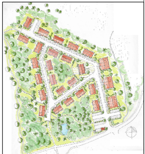
Illustrationsplan över seniorboendet