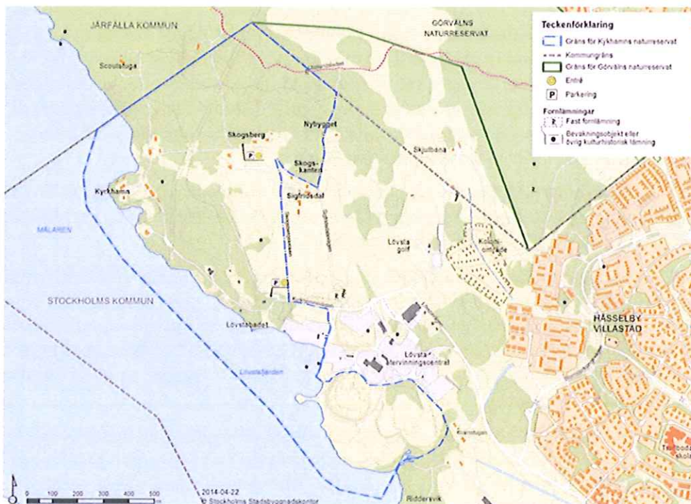
Figur 1: Förslag till gräns för Kyrkhamn naturreservat.