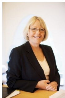
Irene Svenonius Stadsdirektör

Även omvärlden förändras. Påverkan från omvärlden ökar snabbt dels genom en ökande konkurrens om investeringar, kunskap och kapital, dels i form av ett snabbt ökande informationsflöde, import och influenser från omvärlden. Dessa allt snabbare förändringar behöver staden ha kunskap om och hela tiden anpassa sig till för att kunna ge medborgarna en så bra service som möjligt. Under ett par år har vi brett inom staden – på kommunfullmäktiges uppdrag - arbetat med att revidera Vision 2030 – Ett Stockholm i världsklass. Hör gärna av dig med Dina synpunkter på e-post till: vision2030.slk@stockholm.se . Du kan läsa mer på www.stockholm.se/vision2030 .