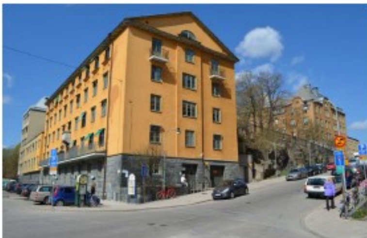
Sjuksköterskehemmet vid Folkungagatan, Erstagatan och sjukhusbyggnaden från 1907.

Sjukhusparken är en viktig del i den ursprungliga sjukhusanläggningen och att bygga på parkmarken försvagar de kulturhistoriska värdena. Gjutjärnsstaketet som avgränsar parken mot gatan är en värdefull detalj i miljön och bergskärningen längst Erstagatan som är miljöskapande och karakteristisk för Söders höjder försvinner om den planerade byggnaden uppförs.