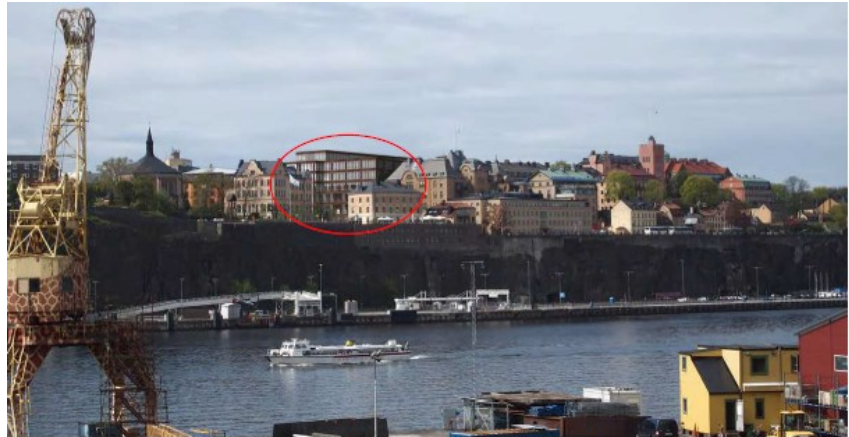
Fotomontage, vy mot det planerade sjukhuset och student- och hotellbyggnaden från Beckholmen (Nyréns arkitektkontor och Ratio arkitekter)

Kulturförvaltningen anser att byggnadens volym måste omstuderas och höjden sänkas betydligt. Volymen bör också dras in från Erstagatan så att bergsskärningen och topografien kan upplevas och en större del av sjukhusparken bör lämnas obebyggd.