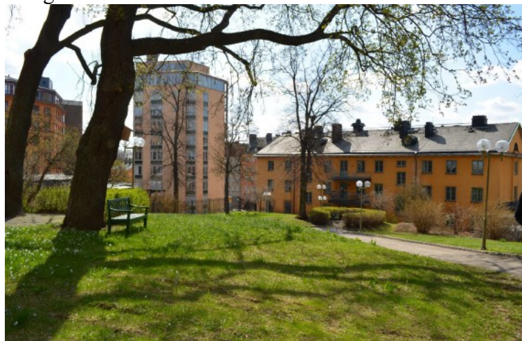
Sjukhusparken. I bildens mitt höghuset i kv. Ersta och till höger Sjuksköterskehemmet.

Kulturförvaltningen ser att nybebyggelse för vårdändamål kan ske inom planområdet. Omfattningen av planerad nybebyggelsen anser dock förvaltningen vara alltför stor. Förvaltningen har ingen erinran mot att befintliga byggnader i västra delen av Rabatten 9 rivs och ersätts med nybyggnad i syfte att få mer effektiva lokaler även om en årsring i utbyggnadsskedet försvinner. Förvaltningen ser också positivt på att befintlig byggnad, Sjuksköterskehemmet i hörnet Folkungagatan och Erstagatan bevaras och får skyddsbestämmelser i plan. Däremot anser förvaltningen att omfattningen av planerad nybyggnad på fastigheten Rabatten 9 är för stor.