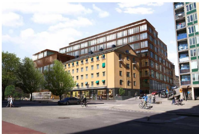
Fotomontage ur illustrationsbilagan.

Fastighetens ramar sprängs av den överstora byggnaden. Den är så hög att närmiljön vid Folkungagatan kommer att påverkas och den befintliga bebyggelsen upplevas om nertryckt. Den planerade nybebyggelsen är också högre än höghuset på andra sidan