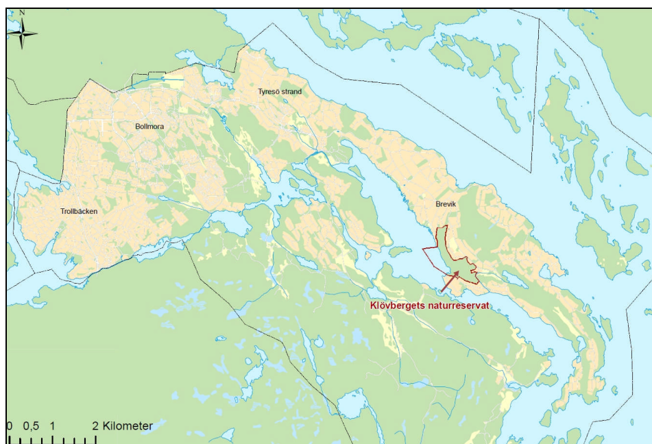
Figur 1. Översiktskarta över Tyresö kommun. Gräns för Klövbergets naturreservat är markerad med röd linje.