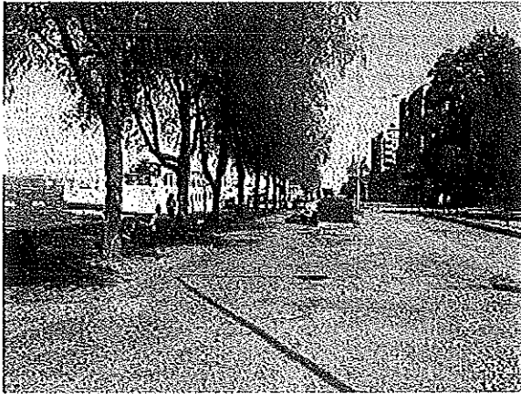
Grusplan Söder Mälarstrand kaj 25

Söder Mälarstrand är som ett vykort över Södermalm och Stockholm. Kajerna och särskilt den västra delen är en omtyckt hälsopromenad. I närheten ligger några av västra Södermalms mest omtyckta grönområden, Långholmen, Tantolunden och Drakenbergsparken. Året runt idrottare, turister och flanörer använder promenadstråket längs kajen även för en uppfriskande promenad längs Riddarfjärdens vattenrum. Vänsterpartiet vill göra Västra Söder Mälarstrand till en grönare och ännu hälsosammare promenadsträcka.