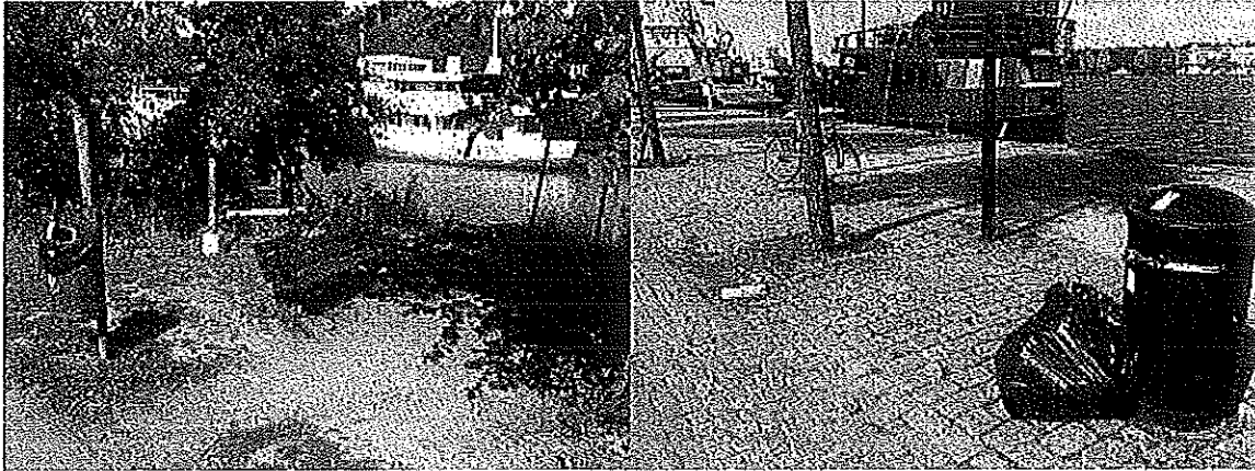
Lilla parken mellan kaj 26 & Långholmen

Vid kajplats 26 finns stora föremål som parkerats där och som bidrar till otrygghet och hindrar utsikten mot Långholmen. Denna plats borde i stället rustas upp med offentliga bänkar och blommor.