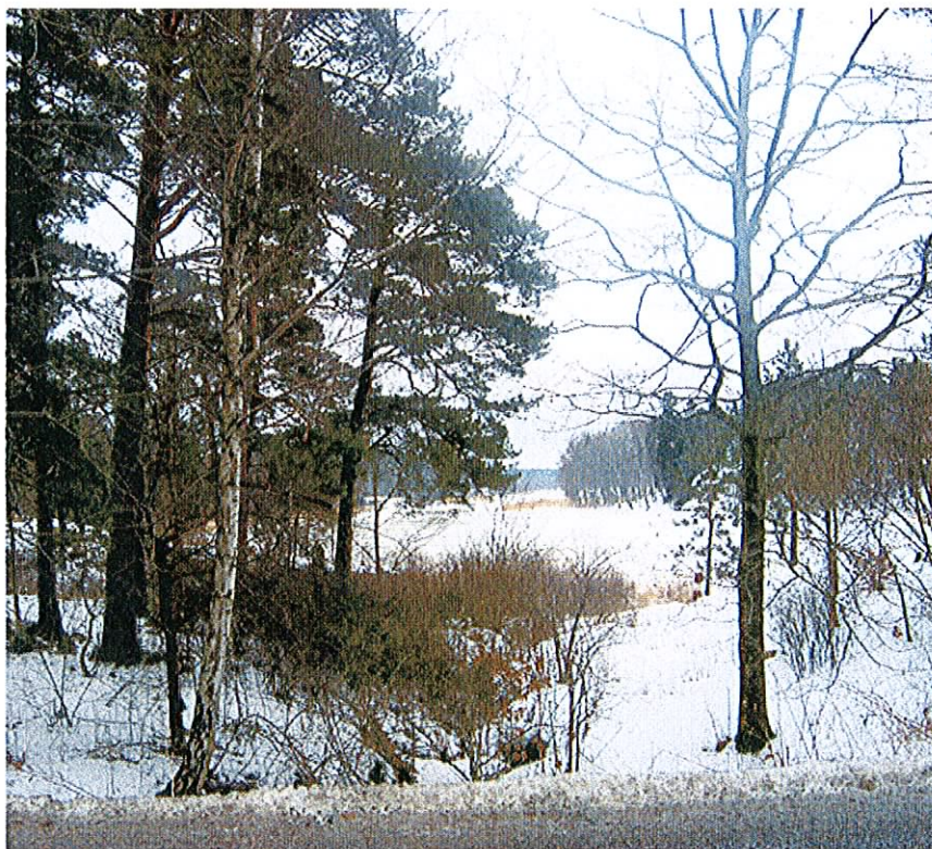
Stallvikens inre del, där en mindre skogsbäck mynnar ut.

Aspekter av dagvattenhantering finns beskrivna i detaljplanen, där lokalt omhändertagande av vatten förespråkas vad gäller tomtmarken. Vad gäller vägarna i området kommer huvuddelen av trafikdagvattnet ledas bort i dagvattenledningar och öppna diken. Ingen ökad påverkan av vattenmiljön i Stallviken befaras som följd av breddning av Breviksvägen. Det är dock viktigt att hänsyn tas till ev. ökade trafikmängder vid dimensionering av omhändertagande av trafikdagvattnet.