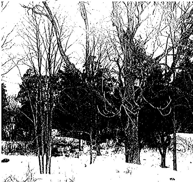
En grov ask med en blandskog av tall, ek och hassel i bakgrunden.

Planområdet består av mycket kuperad mark med karaktär av innerskärgård. På höjderna dominerar barr- och blandskogar, medan det i branter, sluttningar och på lägre mark finns ett stort inslag av lövträd, bland annat ädla lövträd som ek och ask, lind och hassel. Parkstråket på båda sidor om Slottsvägen (Tyresö 1:7) som anslutet till natur- och parkmark kring Tyresö slott bedöms hysa stora naturvärden av kommunalt till regionalt intresse, och har en mycket starkt ekologisk koppling till naturmiljöerna kring slottet och Kalvfjärden. De höga naturvärdena består främst av gamla ekar, ask och hassel, där hålträd och död ved utgör värdefulla element. Utmed stranden finns också ett mindre antal ovanligt grova alar.