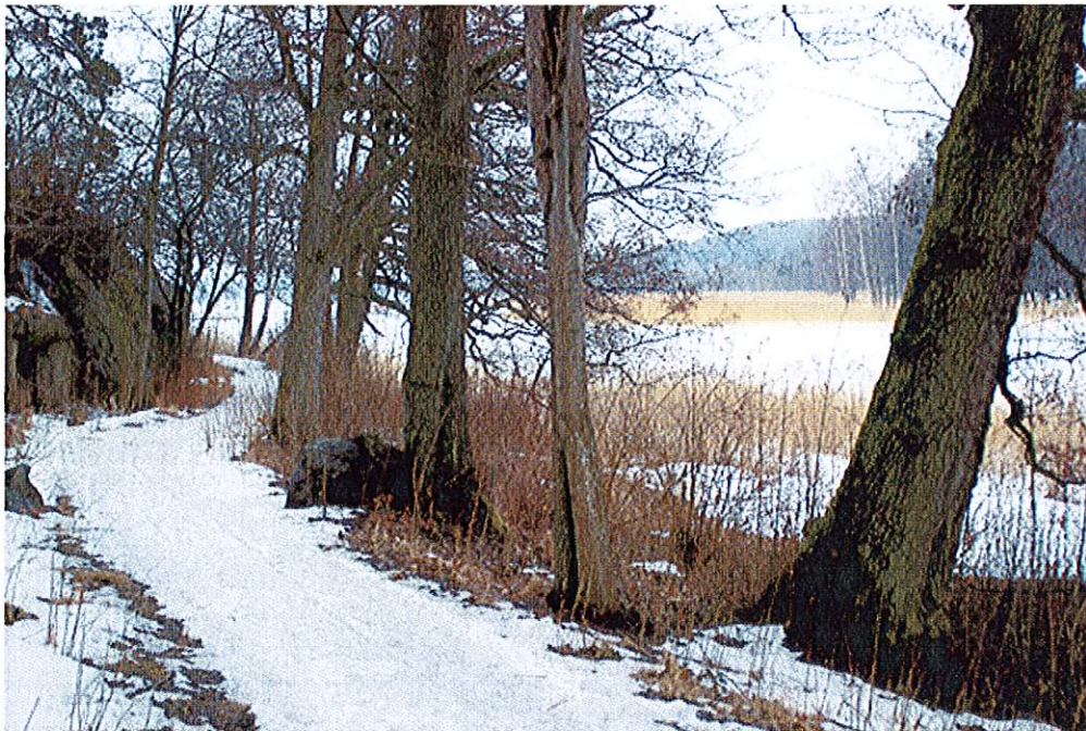
Flertalet av dessa alar kommer troligen att behöva fällas i samband med breddning av gång/cykelväg.

Enligt utförd trädinmätning utmed planerad gång/cykelväg kommer ca 8 av totalt ca 60 inmätta större träd att behöva tas ned, flertalet av dessa är klibbalar som står i en mycket trång passage där en bergklack går ut till strandkanten, i östra delen av parkstråket. En av alarna är ett så kallat jätteträd med en diameter på ca 1,20 meter. Övriga är av klenare dimensioner, se bild nedan.