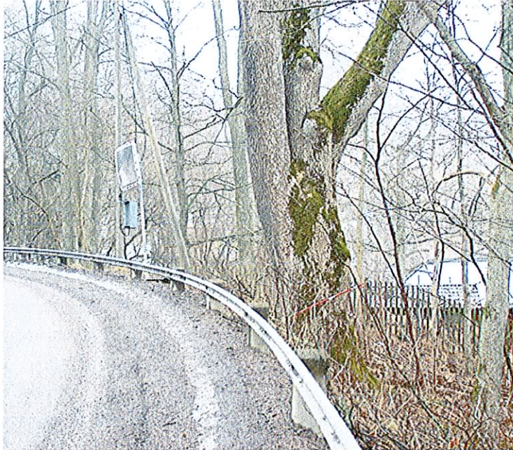
Grov ask utmed Breviksvägen, i skarp kurva, strax öster om Slottsvägens utfart.