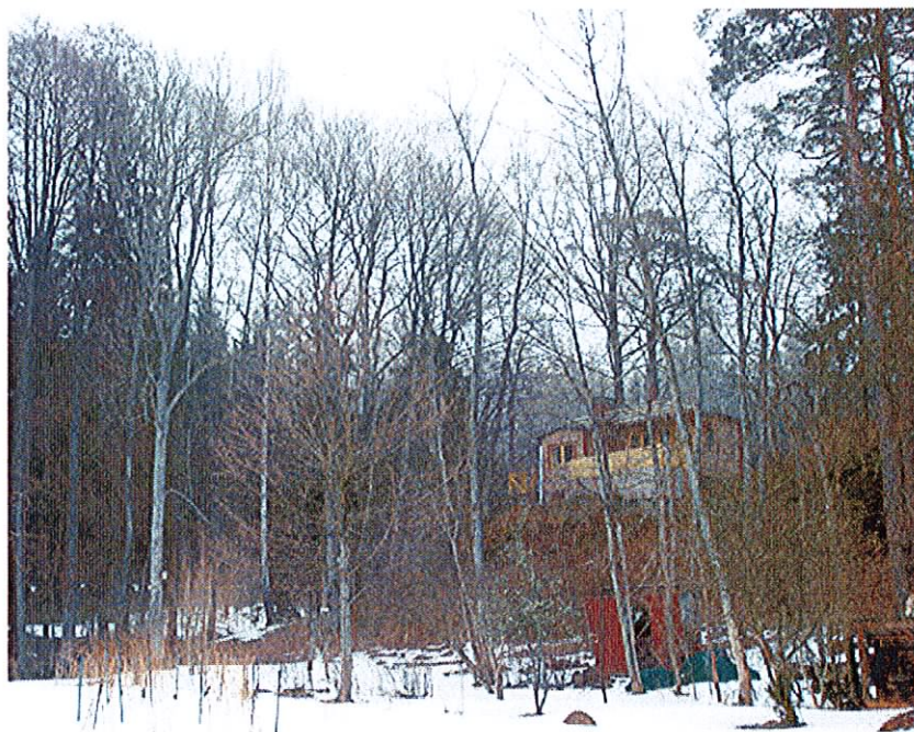
Tomtmark i västra delen av planområdet, med inslag av lövskog, främst ask, ek, al och sälg.

De grova ekarna är känsliga för påverkan på rötterna och ett skyddsavstånd på minst trädkronans bredd bör hållas vid exploatering nära en större ek. Förslagsvis gäller samma skyddsavstånd även för andra grova träd i området, såsom ask och al. I det fall man ändå måste arbeta närmare trädet och rötterna kan påverkas, bör kronan beskäras för att ekens jämvikt för vatten- och näringsförsörjning skall kunna bibehållas till största möjliga mån. ekologisk expertis bör dock medverka vid planering av sådana åtgärder.