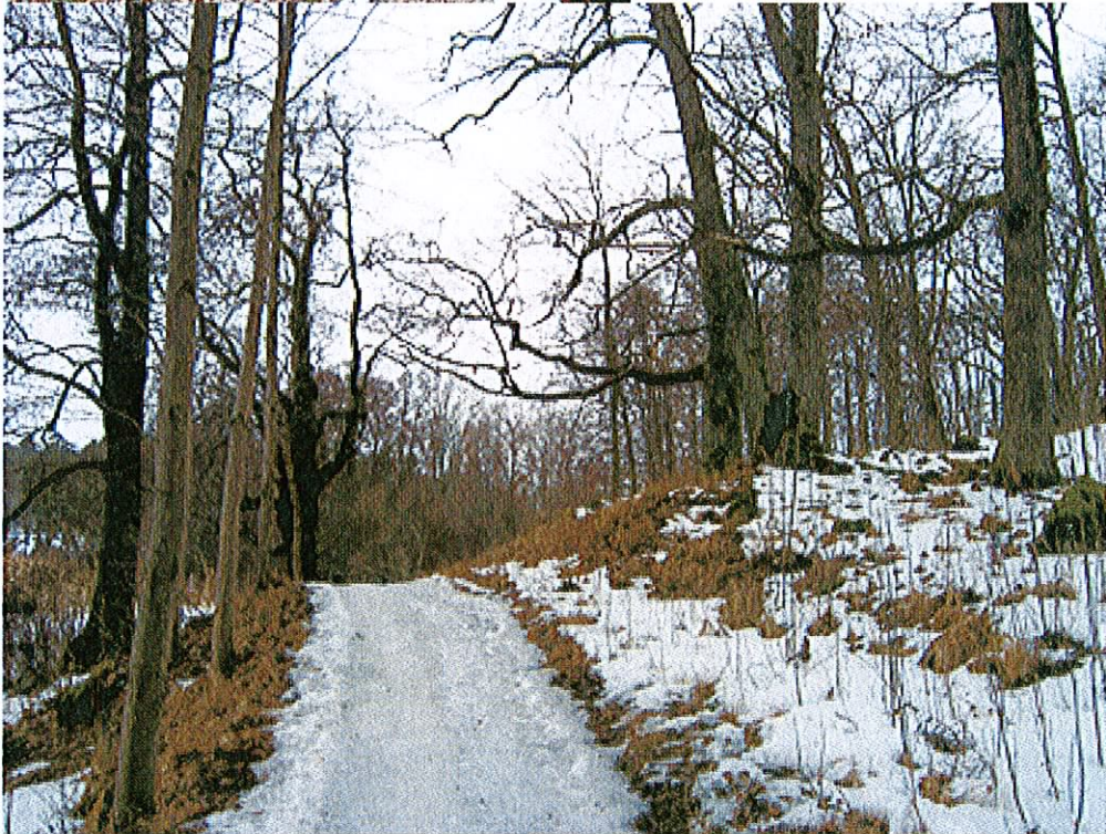
Ädellövdominerad skog i områdets branter och utmed Stallvikens strand.

Flera av träden i planområdet är så kallade "jätteträd" dvs har en stamdiameter på 1 meter eller mer. Dessa träd anses särskilt skyddsvärda i Naturvårdsverkets rapport 5411 om skyddsvärda träd. Områdets största träd är en ek som står utmed Breviksvägen, där vägen gör en skarp sväng strax innan ett öppet parti, i den västra delen av planområdet. Denna ek mäter hela 1,70 me-