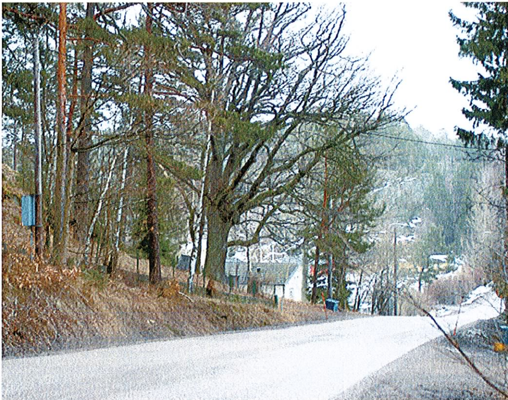
Breviksvägen i östra delen av planområdet, strax innan korsning med Klockargårdsvägen/Bofinksvägen.