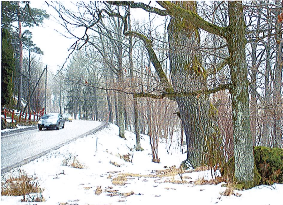
Områdets grövsta träd, en ek med stamdiameter på ca 1,70 m. Trädet står ca 6 meter från Breviksvägen i den västra delen av planområdet och finns utmärkt på karta över värdefull natur och värdefulla träd.

”Utlöpare” av denna lövrika vegetation, med sitt stora inslag av gamla träd, finns även insprängt i tomtmarken, främst på tomterna utmed vattnet, men även i lägre liggande partier mellan de bebyggda höjderna. Värdefulla naturpartier och grova träd är markerade och kortfattat beskrivna på karta nedan.