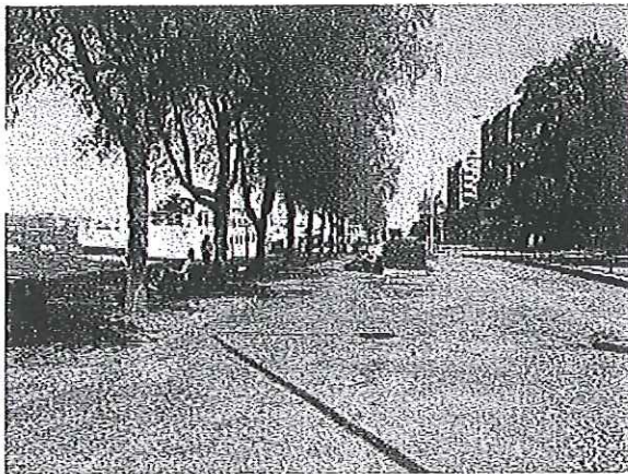
Grusplan Söder Mälarstrand kaj 25

Söder Mälarstrand är som ett vykort över Södermalm och Stockholm. Kajerna och särskilt den västra delen är en omtyckt hälsopromenad. I närheten ligger några av västra Södermalms mest omtyckta grönområden, Långholmen, Tantolunden och Drakenbergsparken. Året runt idrottare, turister och flanörer använder promenadstråket längs kajen även för en uppfriskande promenad längs Riddarfjärdens vattenrum. Vänsterpartiet vill göra Västra Söder Mälarstrand till en grönnare och ännu hälsosammare promenadsträcka.