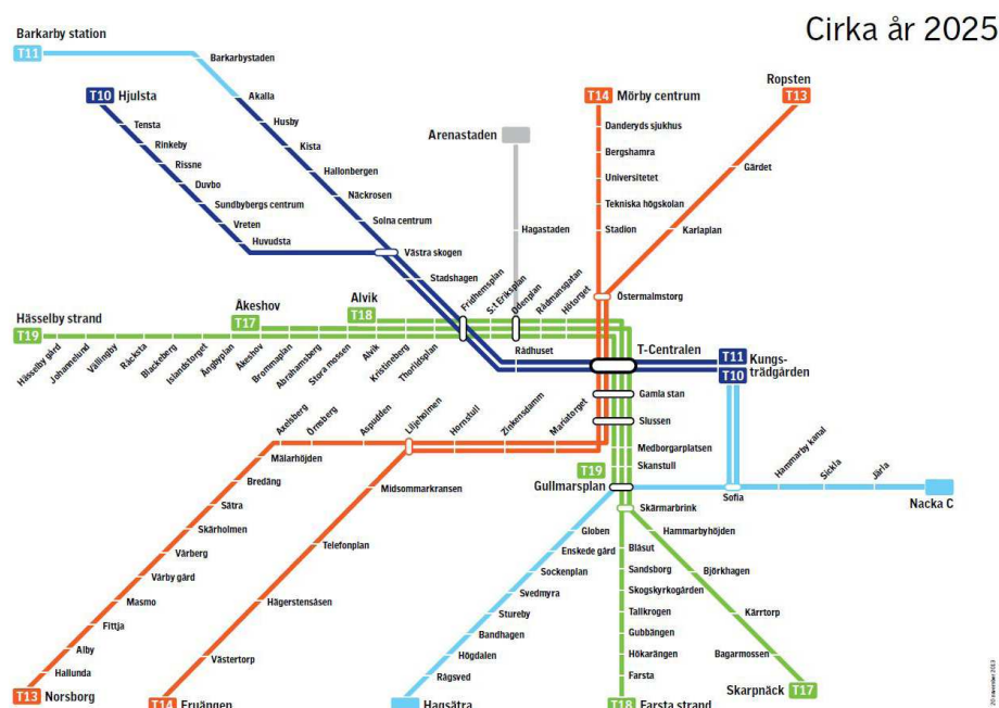
Cirka år 2025

För alla Stockholmsöverenskommelsens vägobjekt finns medel avsatta i Nationell plan för transportsystemet 2014-2025 eller i Länsplan för regional transportinfrastruktur 2014- 2025.