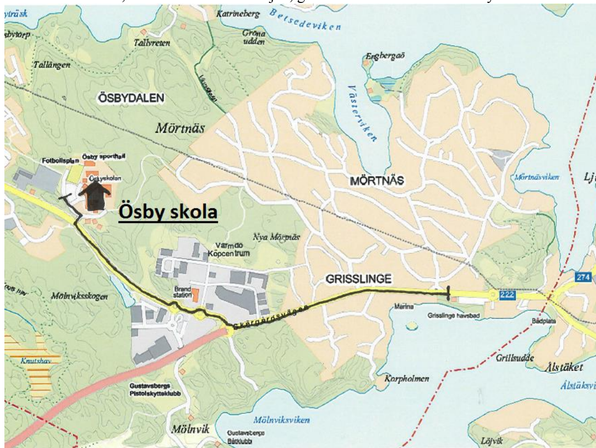
Karta 2. Bussturen, den svart streckade linjen, gäller elever som åker till Ösby skolan.