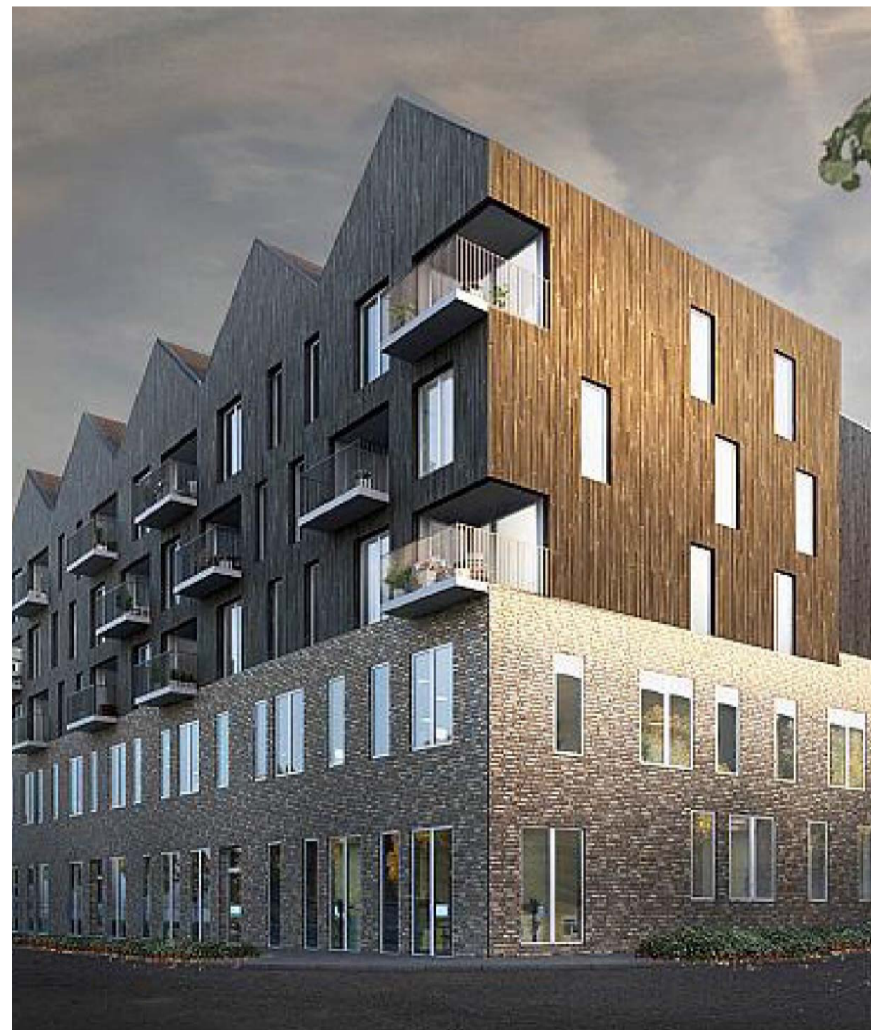
Bildkälla: Tema Arkitekter