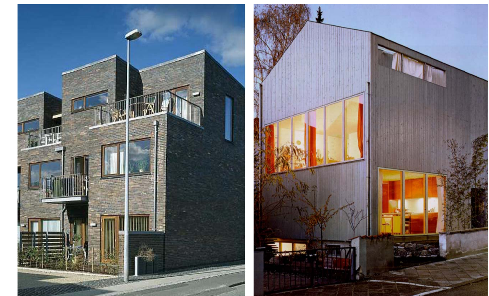
Arkitekt och foto: CH Möller