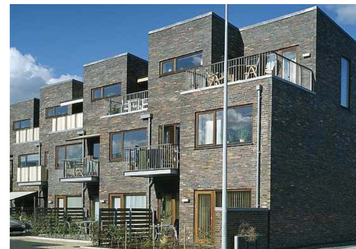
Stadsradhus eller flerbostadshus.