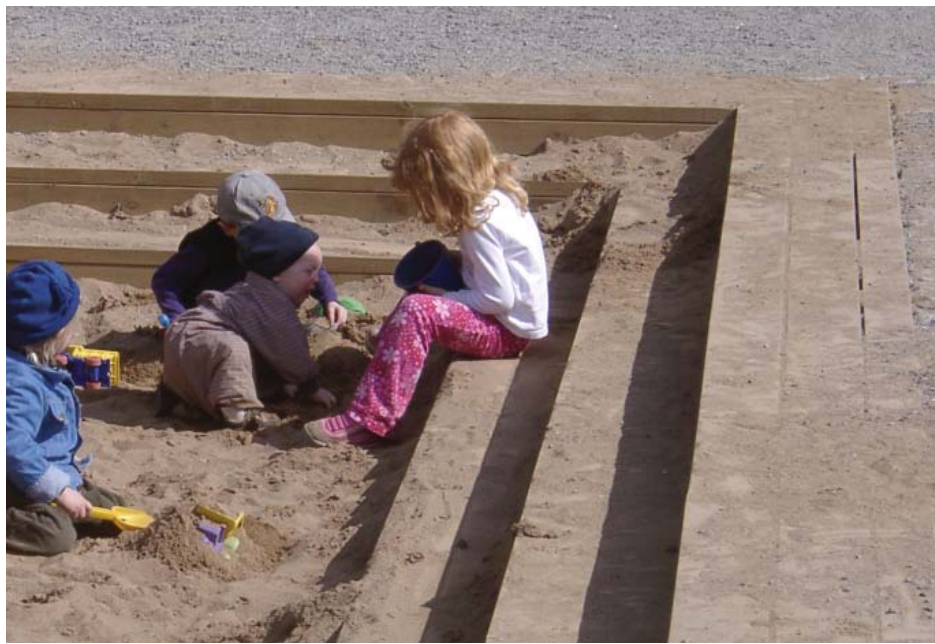
Småbarnslek på gårdar.