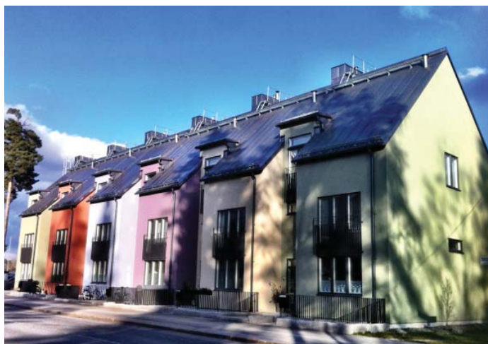
Stadsradhus gestaltade med olika kulörer. Entréer mot gata och mot gård/naturmark.