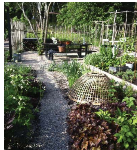
Gemensam odling på parkmark och odling på terrasser och balkonger.