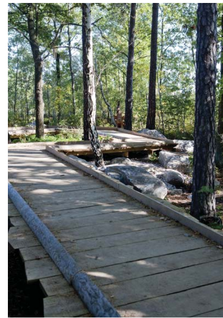
Spänger vid lek intill naturmark.