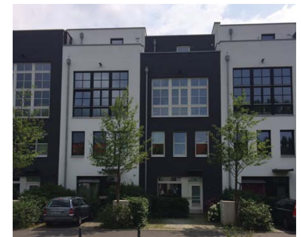
Parkering på förgårdsmark.