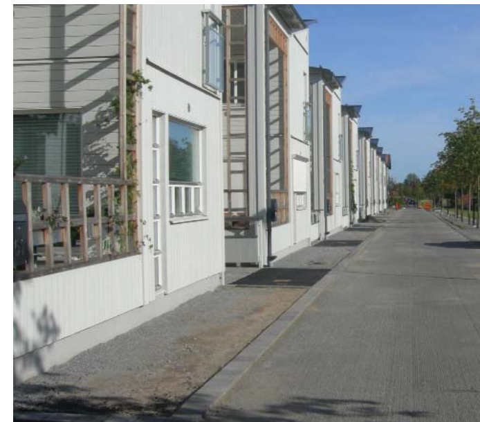
Friser som gräns i gata.