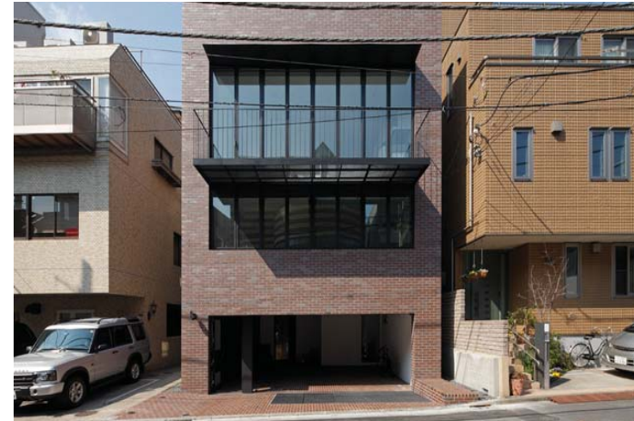
Stadsvilla med tex garage i bottenvåning.