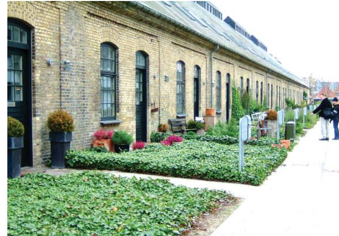
Gröngjord förgårdsmark med plats för sittplats eller cykelparkering.