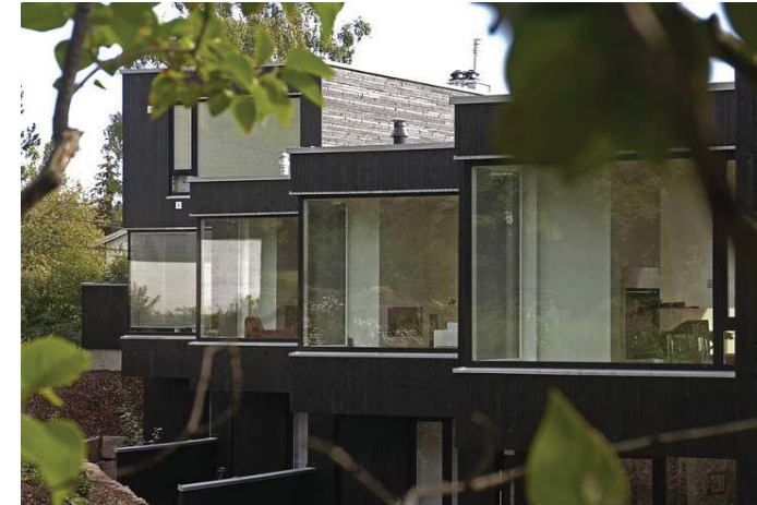
Radhus med generösa ljusinsläpp mot naturen