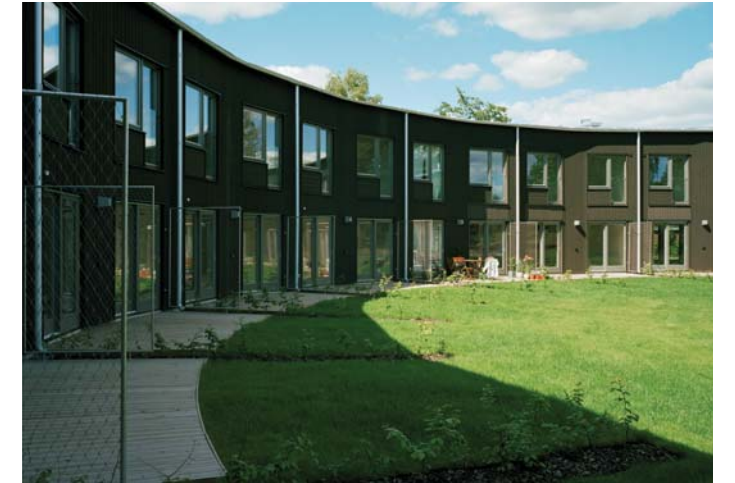
Privata uteplatser mot gemensam grön gård eller mot naturmark.