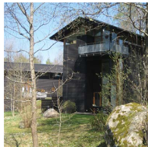
Bebyggelsen möter befintlig naturmark.