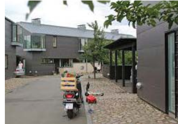
Radhusområde med smala gator och stenlagd förgårdsmark ger möjlighet till lek och samvaro framför husen.