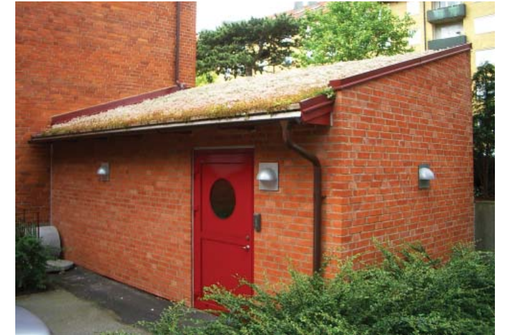
Miljöhus med sedumtak.