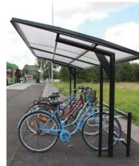
Det ska vara lätt att ta cykeln.