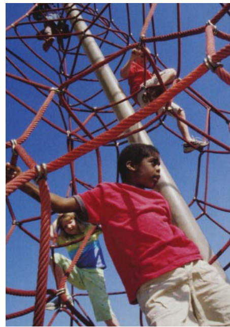
Lek för lite större barn.