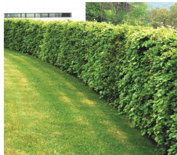
Häckar skapar tydliga gränser i området.