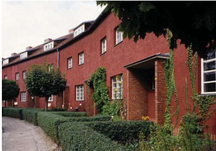
Klassisk gröngjord förgårdsmark i trädgårdsstad.