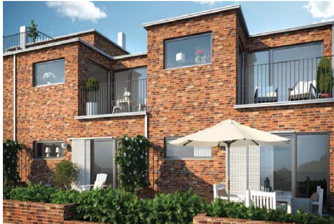
Radhus med traditonella material i tegel.