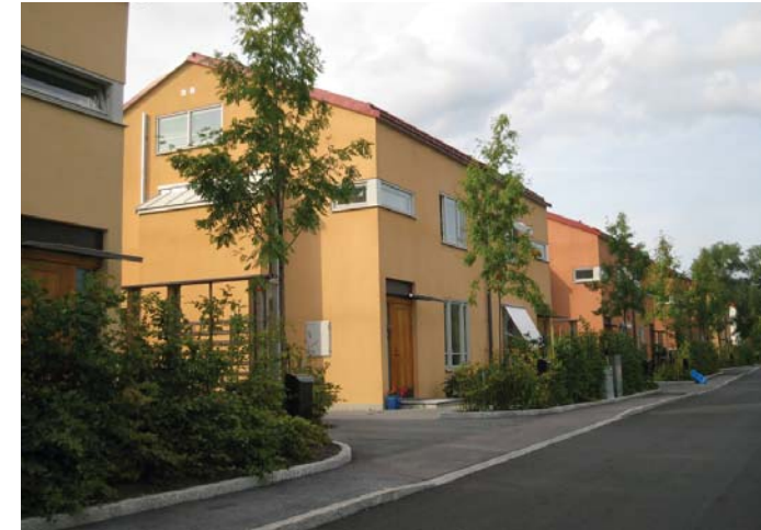
Stadsvilla i puts med grönjord förgårdsmark.