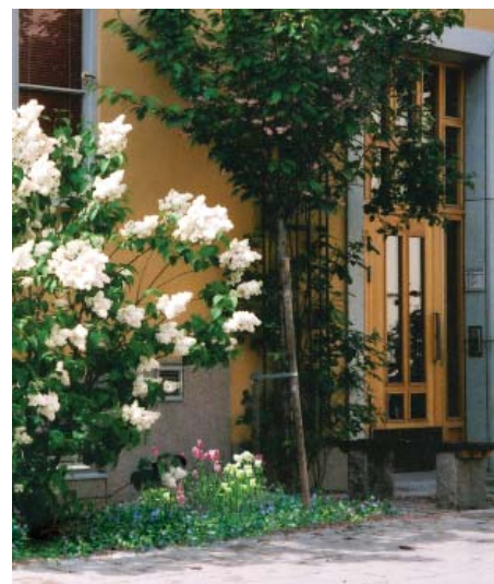
Entréträd och planteringar.