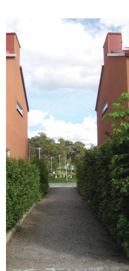
Smitvägar mellan bebyggelse.