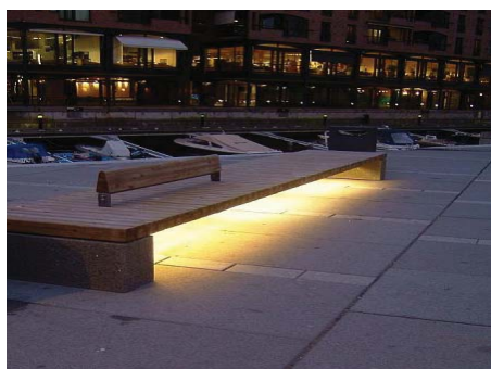
Belysning under parkbänk.