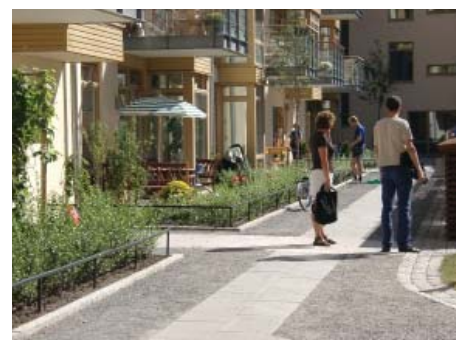
Tydliga gränser och zoner.