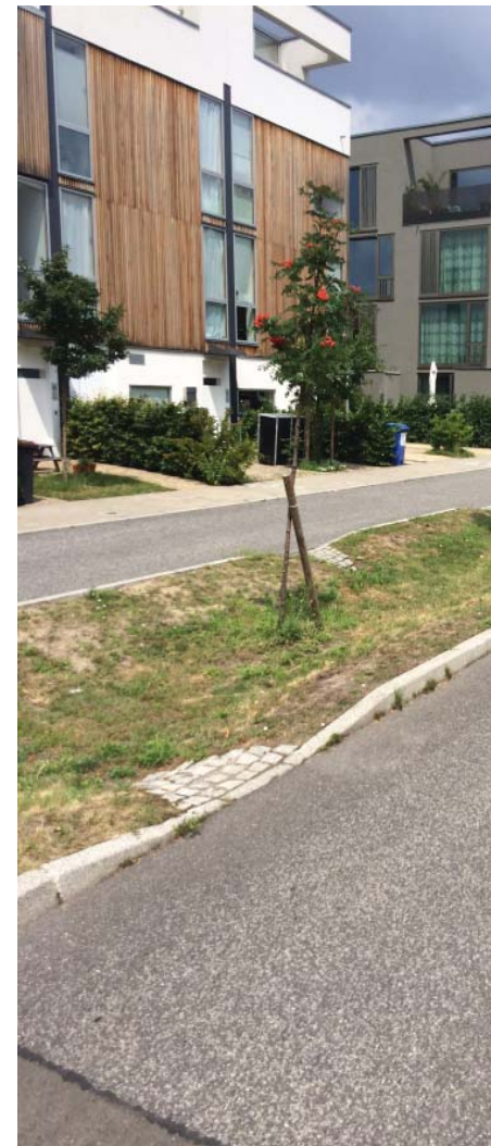
Dagvattendike längs gata för LOD