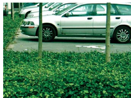
Mindre p-utor med grön inramning.