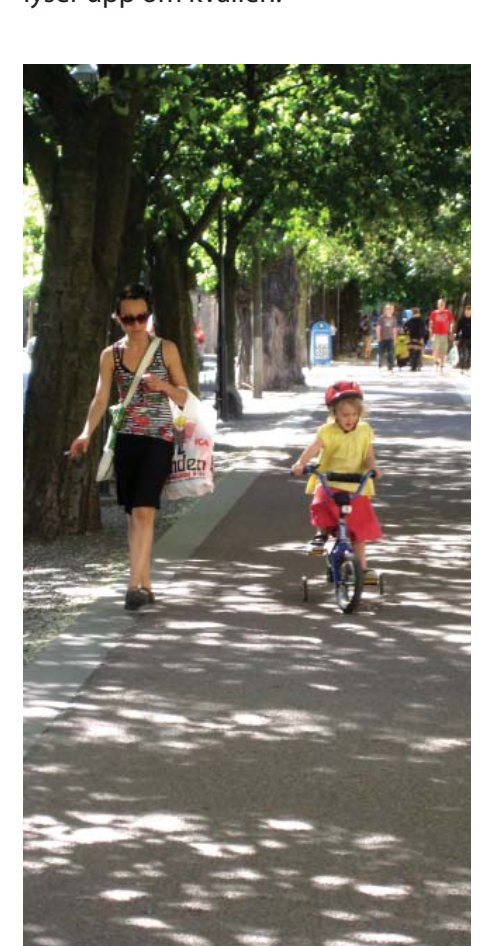
Trygga gång- och cykelstråk.