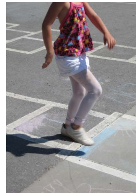
Lek på mindre gata.