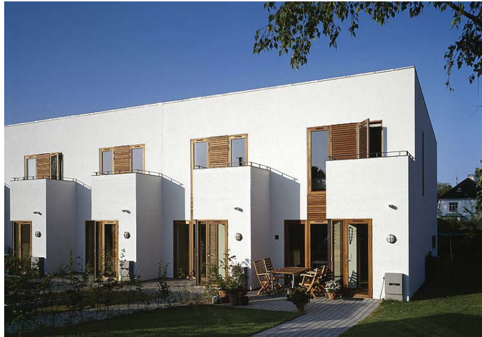
Traditionella radhus med uteplats mot gård eller mot naturmark.