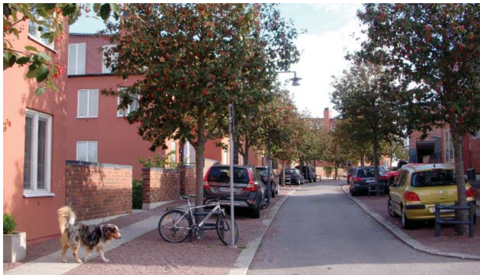
Gatuträd längs gata med kantstensparkering.