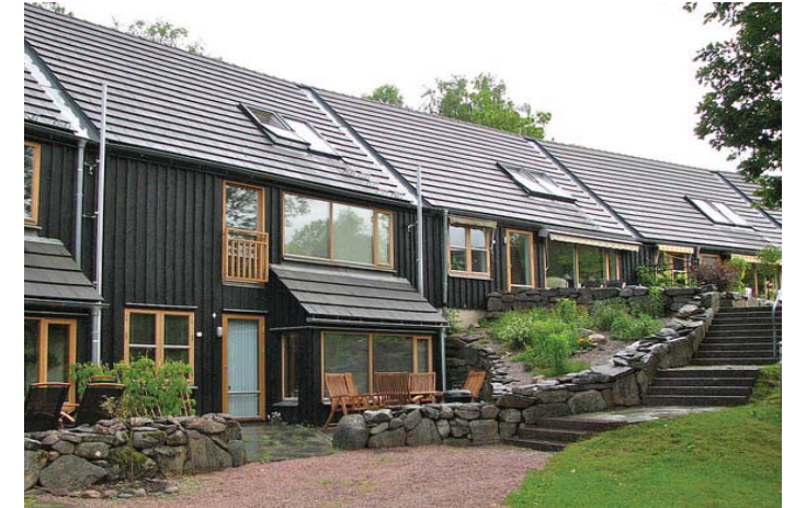
Anpassning till befintlig topografi.