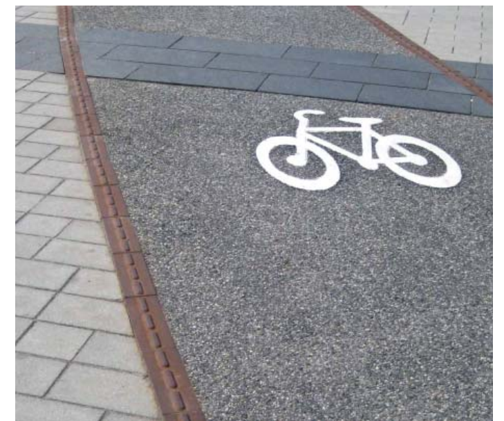
Friser som gräns längs gång- och cykelväg.