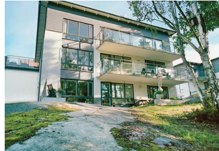
Stadsvilla anpassad till terrängen.