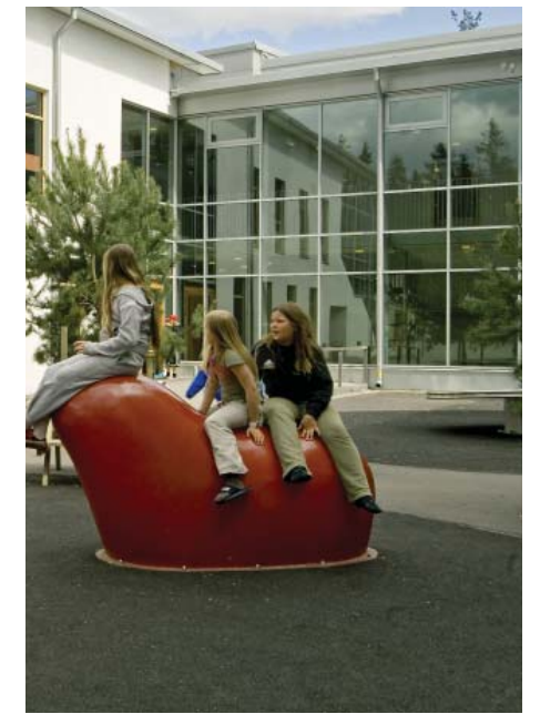
Belysningskulpturer på lekplats lyser upp om kvällen.