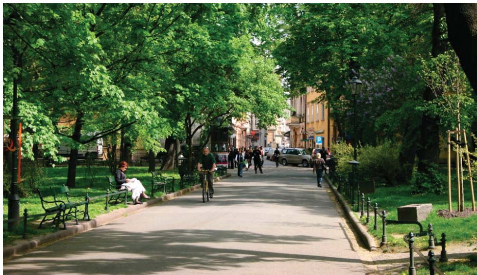
Befintlig gång- och cykelväg i öster sparar.