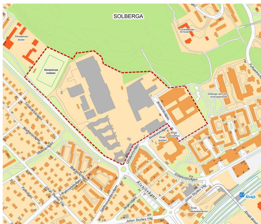
Programområde Kabelverket vid Älvsjövägen-Götalandsvägen.

Programområdet Kabelverket ligger nära Älvsjö centrum vid Älvsjövägen-Götalandsvägen. Det utgörs till största delen av kontors- och industrilokaler som tidigare tillhörde Ericsson. Det program som tagits fram för området innehåller ca 1500 lägenheter, som kommer att fördelas på tre detaljplaner.