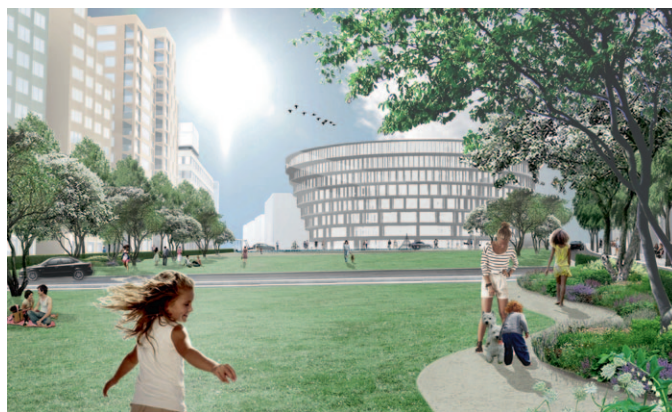
Visionsbild Hagastaden. Illustration: Andersson Jönsson Landskapsarkitekter

Totalt ska vi nu bygga nio nya stationer och nästan två mil nya spår på fyra sträckningar. Omkring år 2025 planeras tunnelbanan rulla till och från både Nacka, Arenastaden och Barkarby. Då kommer också Blå linje från Kungsträdgården att vara ihopkopplad med Hagsätragen.