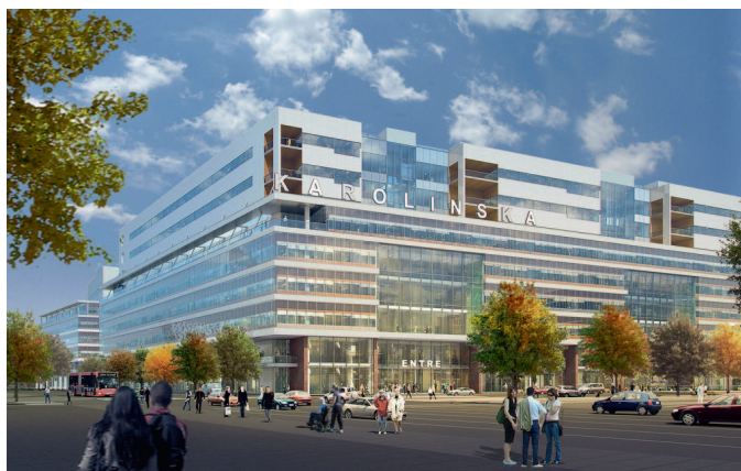
Visionsbild Nya Karolinska Solna. Illustration: White Tengbom Team