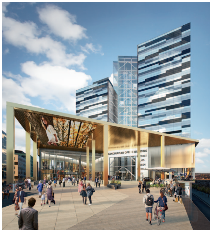
Visionsbild Mall of Scandinavia. Illustration: Tenjin Visual