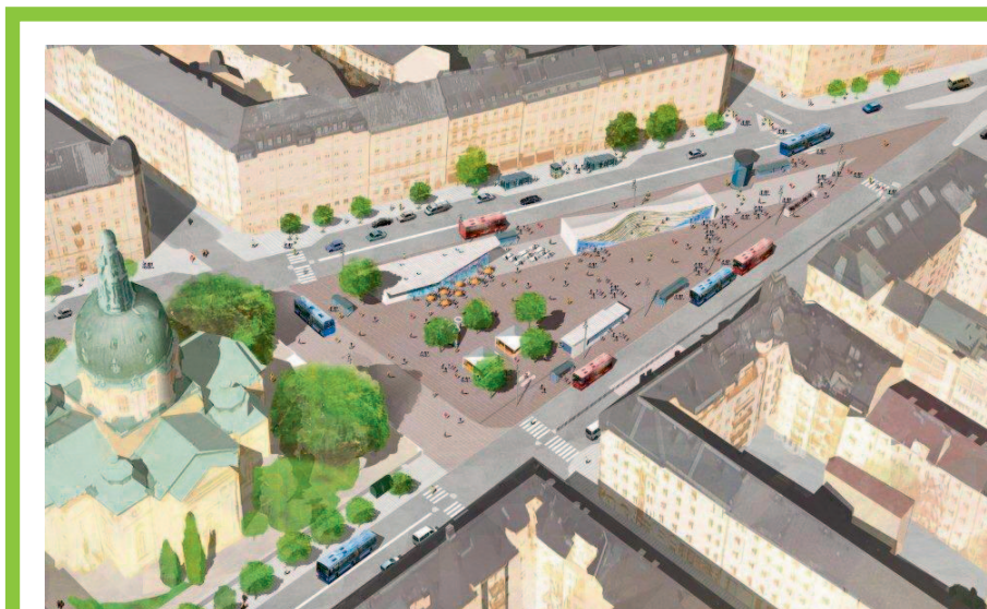
Visionsbild Odenplan. Illustration: KOD Arkitekter