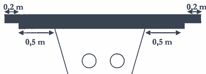
Fig 1: Återställning för gator med AG + toppbeläggning.

Ytbeläggning. Asfaltbeläggning ska återställas till ursprunglig tjocklek, dock minst 40 mm. Skarvar mot befintlig beläggning ska flyttas 0,5 m in på befintlig beläggning så att skarven hamnar på orört underlag. För gator med AG + toppbeläggning (normalt huvudgator) ska skarven mellan asfaltlagren vara förskjuten ytterligare 0,2 m genom anslutningsfräsning enligt figur 1.