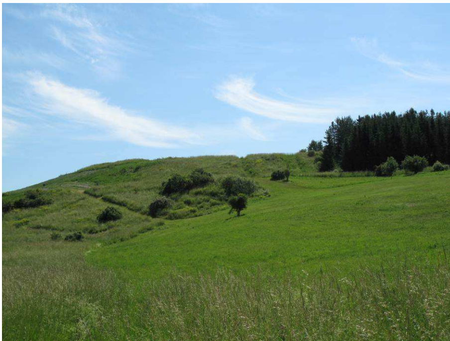
Utsikt mot Granholmstoppen från nordväst

Större delen av planområdet utgörs av Granholmstoppen som är en f.d. deponi för schaktmassor som anlades på tiden när Järvas stadsdelar och tunnelbanan byggdes på 60- och 70-talet. Den reser sig drygt trettio meter över omkringliggande terräng. Innan deponin anlades på platsen fanns där ängar och våtmarker. När tippningen avslutats jordtäcktes den och fick en noggrann gestaltning med platåer, raviner och trädplanteringar. Efter skred på 70-talet anlades tryckbankar i sydost och i norr för att stabilisera toppen. Även tryckbankarna har delvis planterats med träd. Relativt uttorkade rester av våtmarkerna finns ännu kvar sydost om tryckbanken. I den östligaste delen av planområdet finns öppen mark och ett höjddparti med gammal barr- och blandskog.