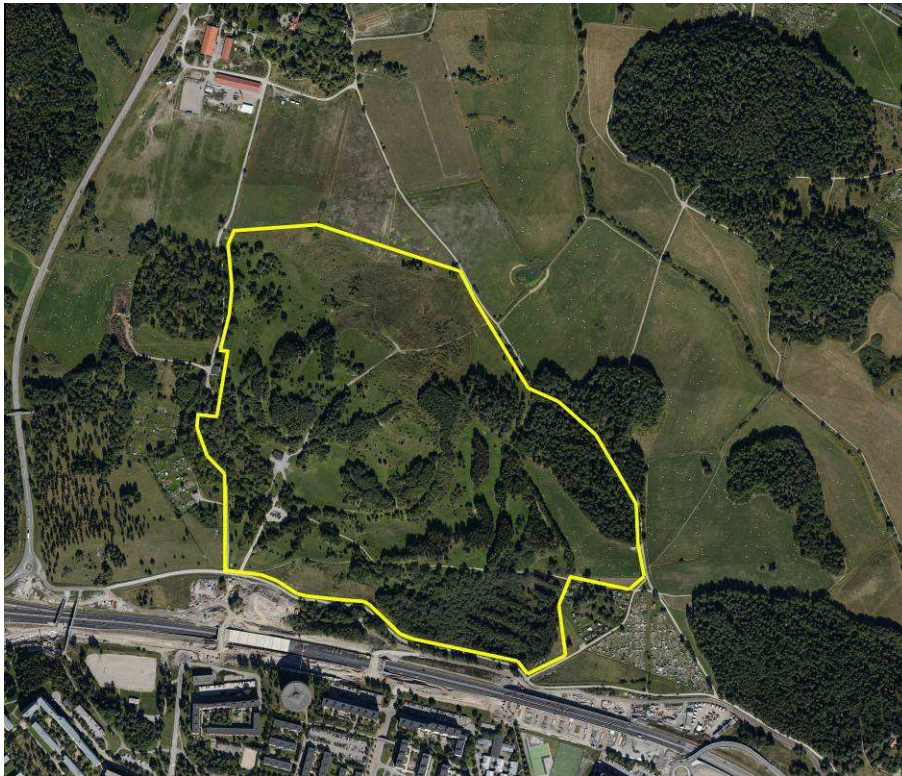
Planområdet markerat i gult. Norr om planområdet ligger Hästa gård. Söder om planområdet går E18 med den nya överdäckningen och ytterligare söder om E18 börjar Tensta.