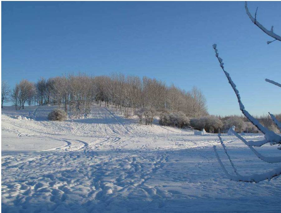
Granholmstoppen används vintertid för skidåkning och pulkaåkning.

Hela friområdet utnyttjas i hög grad för promenader, jogging, natur- och kulturupplevelser, m.m. Granholmstoppen med sin utsikt är en av friområdet mest populära målpunkter och används också som pulka-backe på vintern. På Granholmstoppen finns sedan 1995 en uppskattad discgolfbana och den norra sidan av toppen används för skärmflygning.