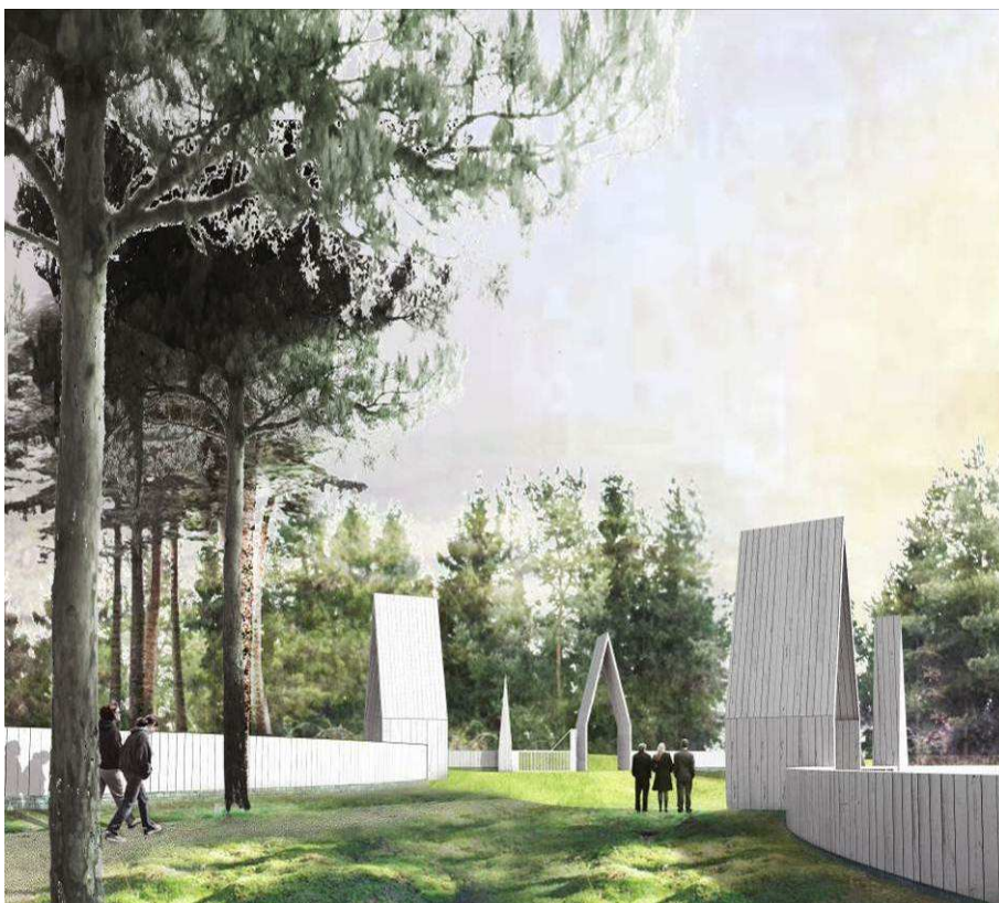
Illustration på entrébyggnaderna till gravöarna ur gestaltningsprogrammet

Entréerna till gravöarna ska ges en tydlig utformning och kan förses med mindre skärmtak och servicestationer för avfallshantering och vattenhantering. Muslimska gravkvarter ska erbjuda möjlighet för en mer rituell tvättning innan man beträder kvarteren. Det kan också bli aktuellt med kompletteringar med mindre toalettbyggnader inom de områden som ligger långt ifrån övriga toaletter.