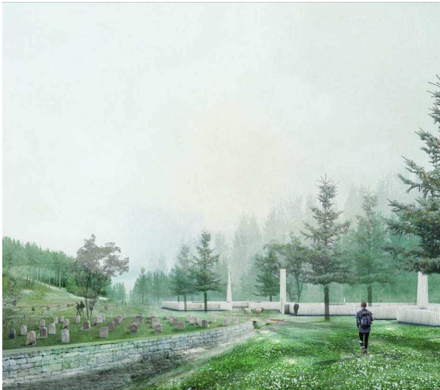
Illustration på gravöarna och landskapet ur gestaltningsprogrammet. Till vänster illustreras ett steninklätt s.k. ha-ha dike till höger staket i trä.

Alla begravningsplatserna anläggs som begravningsöar; enskilda enheter i landskapet. Begravningsplatserna ska ta färg och namn efter placeringen i landskapet. Landskapet mellan öarna ska vara tillgängligt för alla och vara rum för tillfälliga möten. Varje begravningsö utgörs av ett kvarter med en tydlig avgränsning som kan vara ett steninklätt så kallat ha-ha dike, ett staket i trä, eller stenformationer i landskapet. Öarna ska ha tydliga entréer som utgör skarpa distinktioner mellan upplevelsen av att röra sig inne i begravningskvarteret eller ute i det omkringliggande rekreativa landskapet.