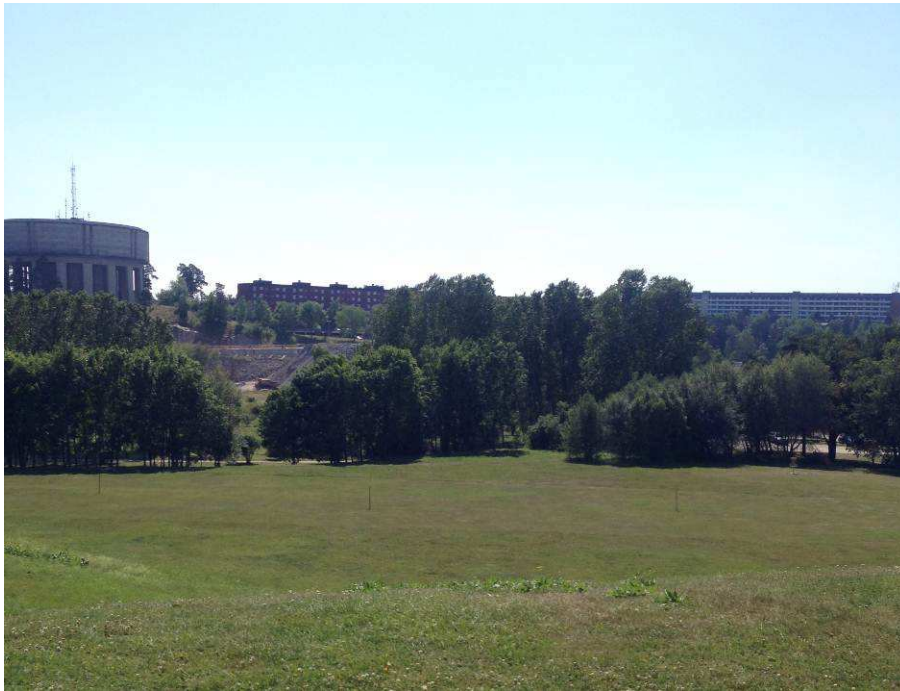
Vattentornet i Tensta och bostadsbebyggelse i Hjulsta sett från Granholmstoppen.