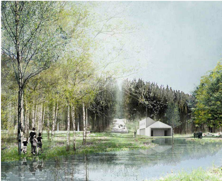
Illustration på ceremonibygnaden i etapp 1 ur gestaltningsprogrammet

Entréerna till gravöarna ska ges en tydlig utformning och kan förses med mindre skärmtak och servicestationer för avfallshantering och vattenhantering. Muslimska gravkvarter ska erbjuda möjlighet för en mer rituell tvättning innan man beträder kvarteren. Det kan också bli aktuellt med kompletteringar med mindre toalettbyggnader inom de områden som ligger långt ifrån övriga toaletter.