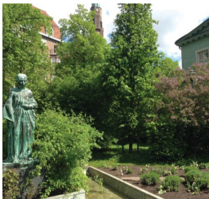
Ellen Keys staty i grönskande omgivning

Parken användas av många grupper och har en relativt stark lokal förankring. Dagtid använder ungdomar från de omkringliggande skolorna parken på raster, lektioner, avslutningar m.m. Gräsmattan i mitten används till bollspel och lek. En större grupp hundägare använder och träffas dagligen i parken. Boende i direkt anslutning till parken använder parken som komplement till sina bostadsgårdar. En mindre grupp äldre använder återkommande den övre terrassen som träffpunkt. Ett intilliggande café använder också delar av parkytan utanför murarna till sin servering.