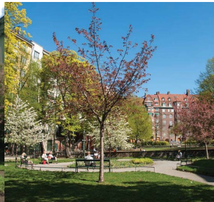
Ellen Keys parks nedre terrass.