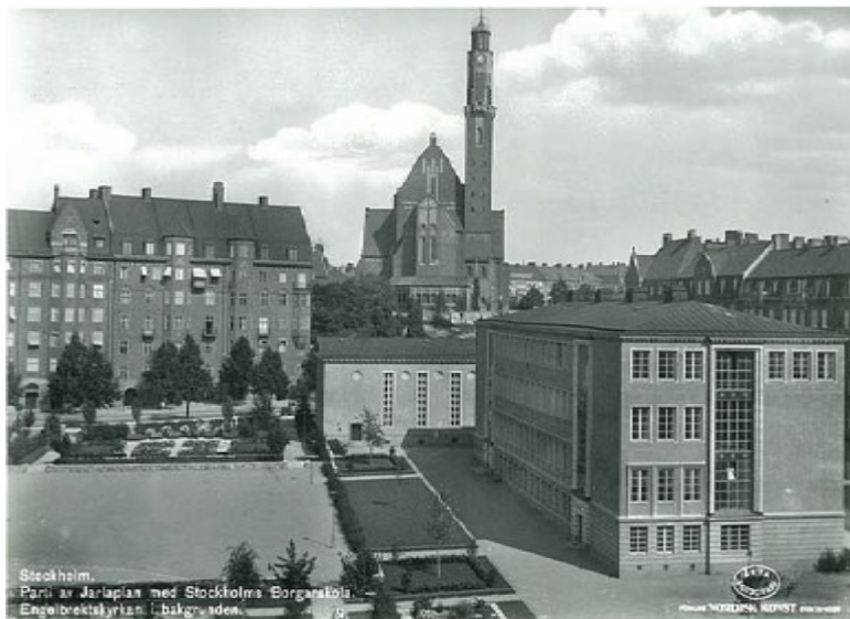
Ellen Keys park i sin tidigaste skepnad.