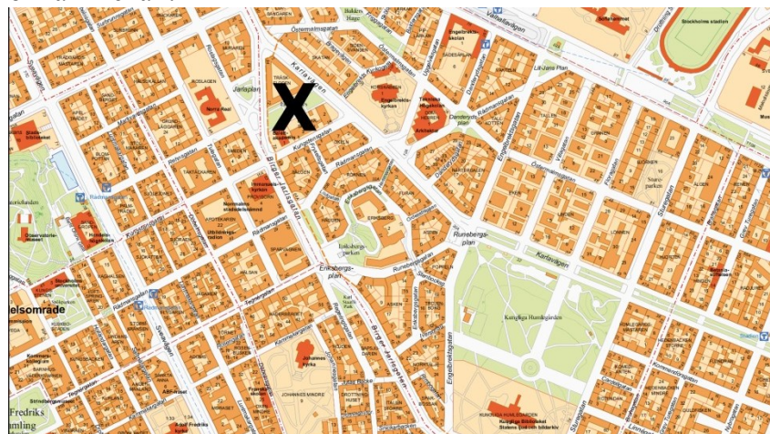
Krysset visar var Ellen Keys park ligger.

På 1800-talet började västra sidan bebyggas, först med stall och därefter det palatsliknande kontorsbygget vid Tegnérgatan. Runtomkring fanns skjul, tobaksodlingar och planteringar. Åren 1879- 1884 pågick igenfyllning av sjön och den avslutades helt under 1890 talet då marken höjdes i nivå med Roslagsgatan. När den till stilen nyklassicistiska Borgarskolan byggdes 1930-1932 revs de sista resterna av kåkbebyggelsen. Det var också då som Ellen Keys park anlades med planteringar, murar, en plaskdamm, lekplan och sittplatser. Parken kallades då Jarlaparken och fick namnet Ellen Keys park först i början av 2000-talet. Parkens formspråk är nordisk klassicism eller nyklassicism. Den delades in i tre terrasser som skiljdes åt med stenvmurar, och terrasserna gavs olika innehåll.