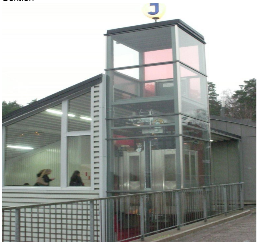
Vy från bron