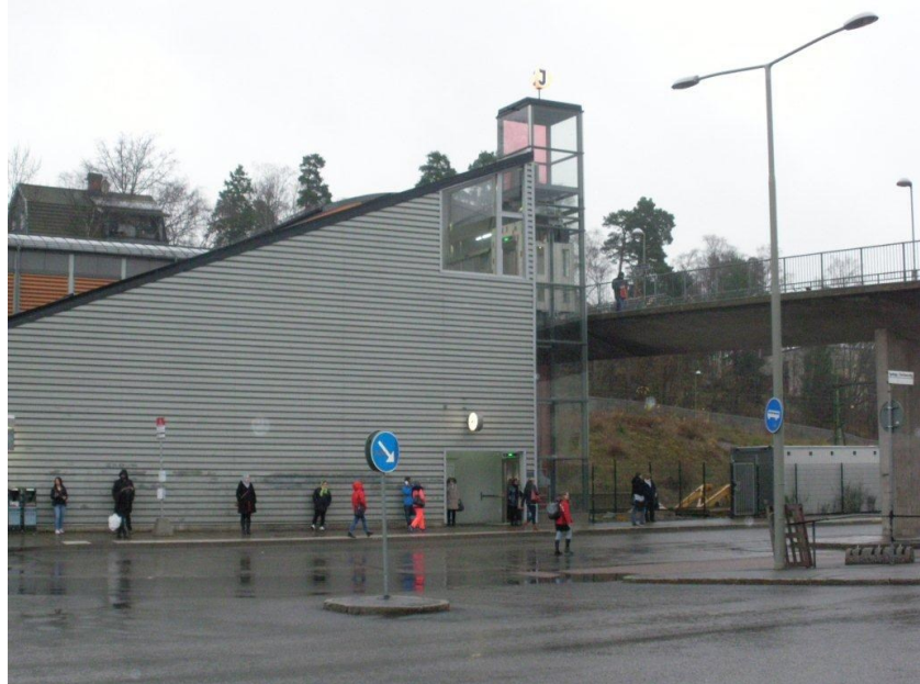
Spånga stations trapphus med ny hiss

För arbetena med utbyte av rulltrappa, trappans ytskikt samt renovering av rulltrappans stålstomme fordrades inget bygglov varvid ombyggnadsarbetena inleddes omgående.