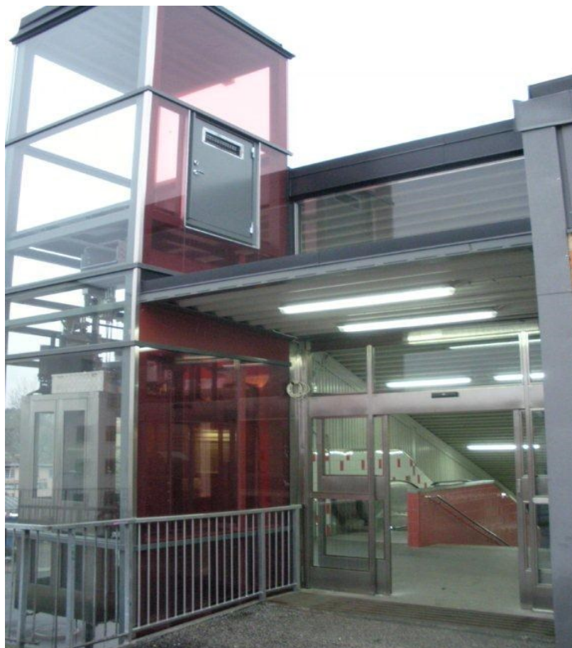
Entré övre vilplan

Anläggningen övervakas med hjälp av SL/Trafikförvaltningens kamera- och larmsystem.