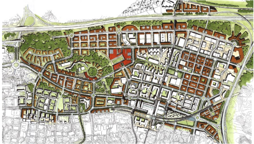
Strukturplanen för Kista Science City.

Området är idag planlagt för idrottsändamål. Idrottsverksamheten flyttades i början av 2000-talet till att ligga mer centralt i bostadsområdena i Akalla, Husby och Kista. Idag används en del av det aktuella området för parkering. Parkeringsplatsen arrenderas ut till intilliggande kontorsfastighet.