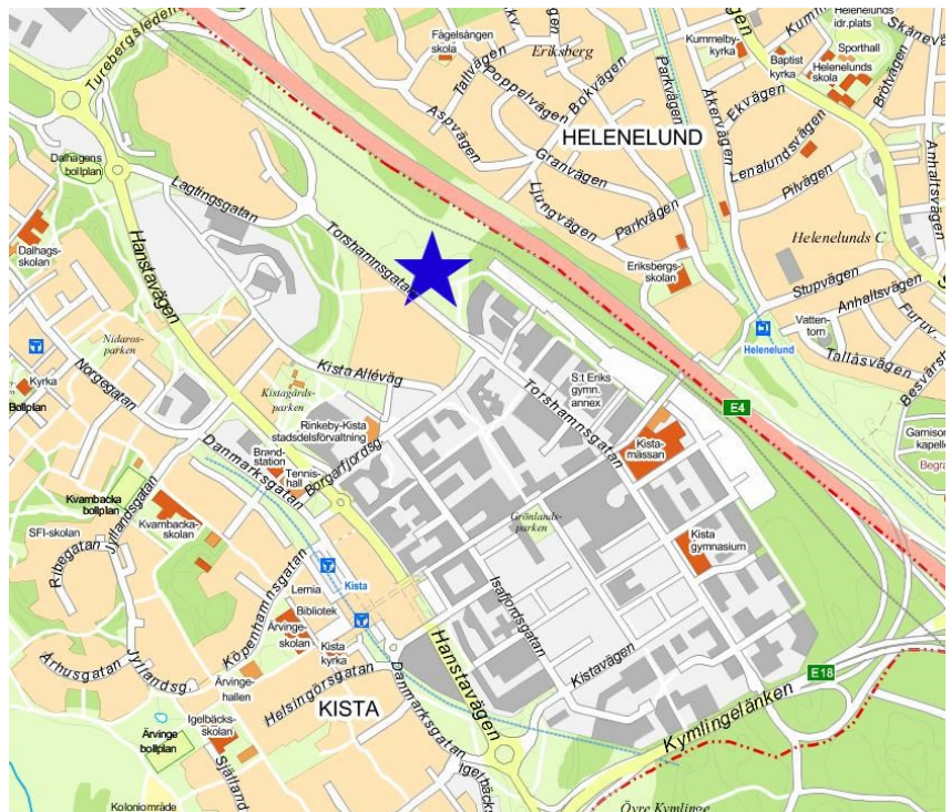
Markanvisningsområdets läge i Kista.

Utbyggnadsförslaget är planerat i norra delen av Kista, i området mellan Torshamnsgatan och E4:an, i direkt anslutning till det kommande bostadsområdet Kista Äng.