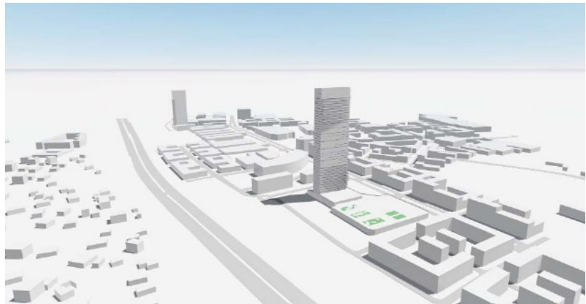
Vy mot söder längsmed E4:an.

Exploateringsens innehåll och utformning kommer att prövas i planprocessen.