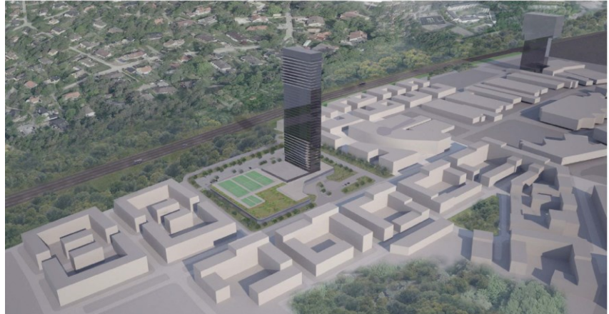
Vy mot nordost.