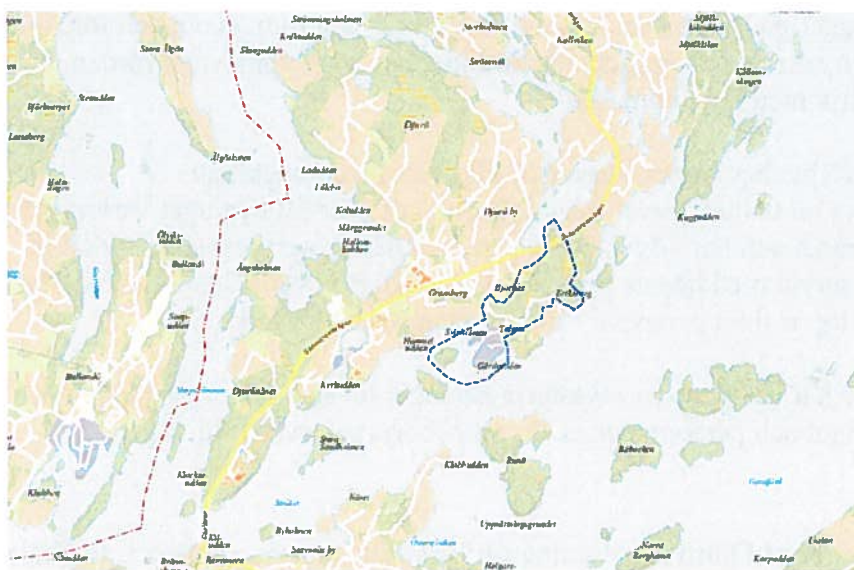
Karta 1: Blå streckad linje visar utredningsområdet, gränsen fastställs vid senare beslut.

Därefter fattar nämnden beslut i ytterligare två skeden; ett beslut om skötselplan och samråd med berörda aktörer samt ett senare beslut om avgränsning och att bilda reservatet. Hela processen tar ca två år och beskrivs i detalj i naturreservatsplanen.