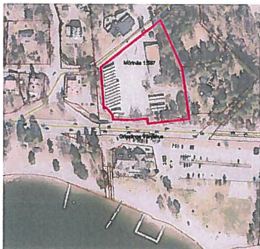
Mörtnäs 1:587 ligger vid väg 222, norr om Grisslinge vårdshus.

Trafikverket utreder under 2015-2016 en breddning av väg 222. Kommunen arbetar samtidigt med detaljplaner i området M5 och M10 i Mörtnäs. Dessa planer omfattar bebyggelse och anläggningar på båda sidor av väg 222 genom Grisslinge.