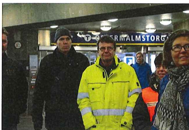
Bilden: På plats vid T-banestation Östermalmstorg.