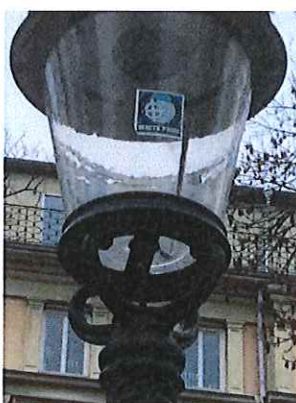
Bilden: Klistermärke med rasistiskt budskap på belysning vid Humlanhuset.