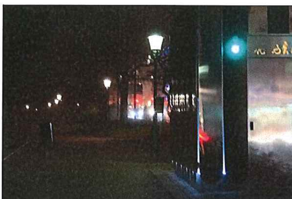
Bilden: Gångväg i Humlegården med stadstoallett intill Sturegatan