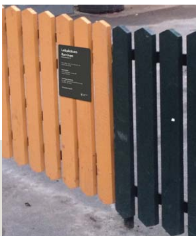
Lekplatsskylt på staket