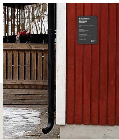
Lekplatsskylt monterad på fasad