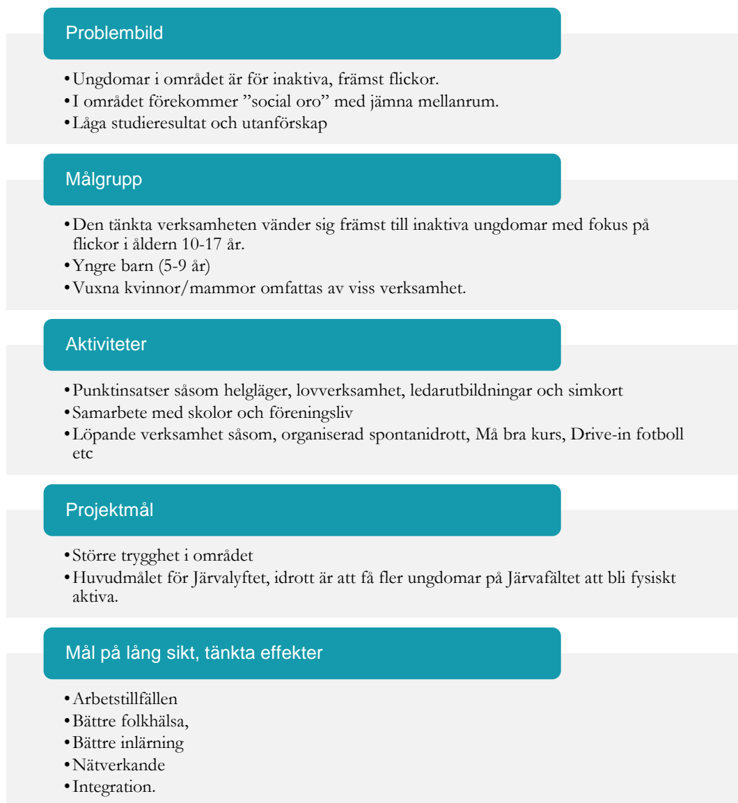
Figur. 5 Projektets programlogik

Det kan konstateras att Järvalyftet Idrott är baserad på en tydlig problembild och en relativt tydligt framskriven målgrupp. Det finns dock problem med att de mål som beskrivs på kort och lång sikt är mycket övergripande och oprecisa. Detta ger stort utrymme för tolkning. Flertalet av målen nämns i