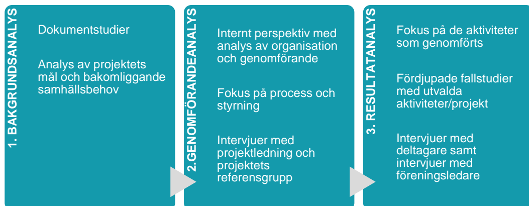
Figur 1. Metod

Sweco har intervjuat projektledaren för Järvalyftet Idrott och talat med samtliga i projektets referensgrupp. I syfte att diskutera frågor som kommit upp i intervjuerna genomfördes också en workshop med referensgruppen. Ett antal fallstudier har också fullbordats där intervjuer med de som arbetar operativt med olika typer av verksamheter samt de som deltar i aktiviteterna intervjuats enskilt och i grupp. Därutöver har den enkät som kartlägger ungas levnadsvanor i Stockholms stad (Ung livsstil), deltagarstatistik och dokument kopplade till projektet studerats.