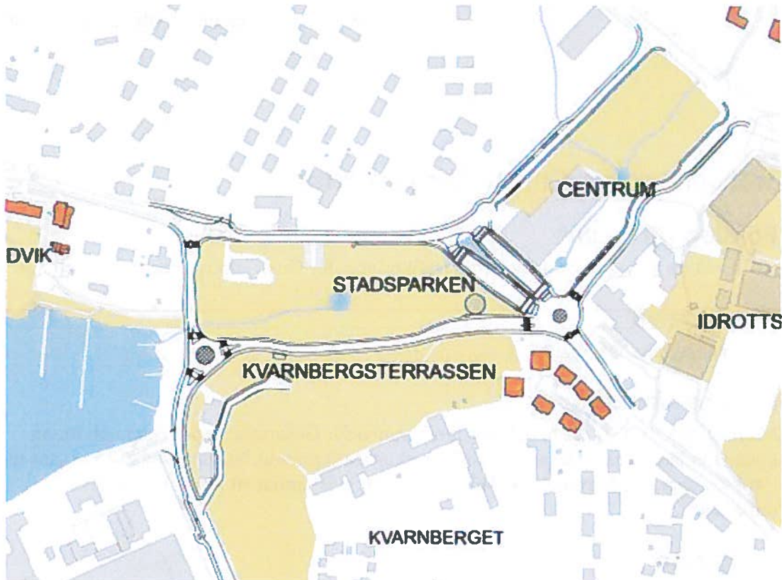
Bild 1: Bilden visar det föreslagna Stadsgatunätet i Gustavsbergs centrum.

Denna rapport redovisar tre möjliga trafiklösningar, av dessa tre alternativ förordas Stadsgatunätet då detta bedöms ha störst potential att uppnå visionen för framtidens Gustavsberg.