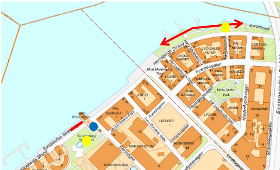
Föreslagen sträcka för bryggbad – röd linje. Allmän toalett – blå prick. Dusch – gul prick

Bryggan/kajen mellan Lindhagensgatan/Elersvägen är idrottsförvaltningen intresserad av att anordna förtöjning av småbåtar.