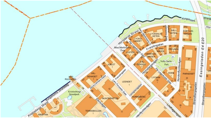
Läge för den föreslagna officiella badplatsen samt var bad bör kunna tillåtas på egen risk.