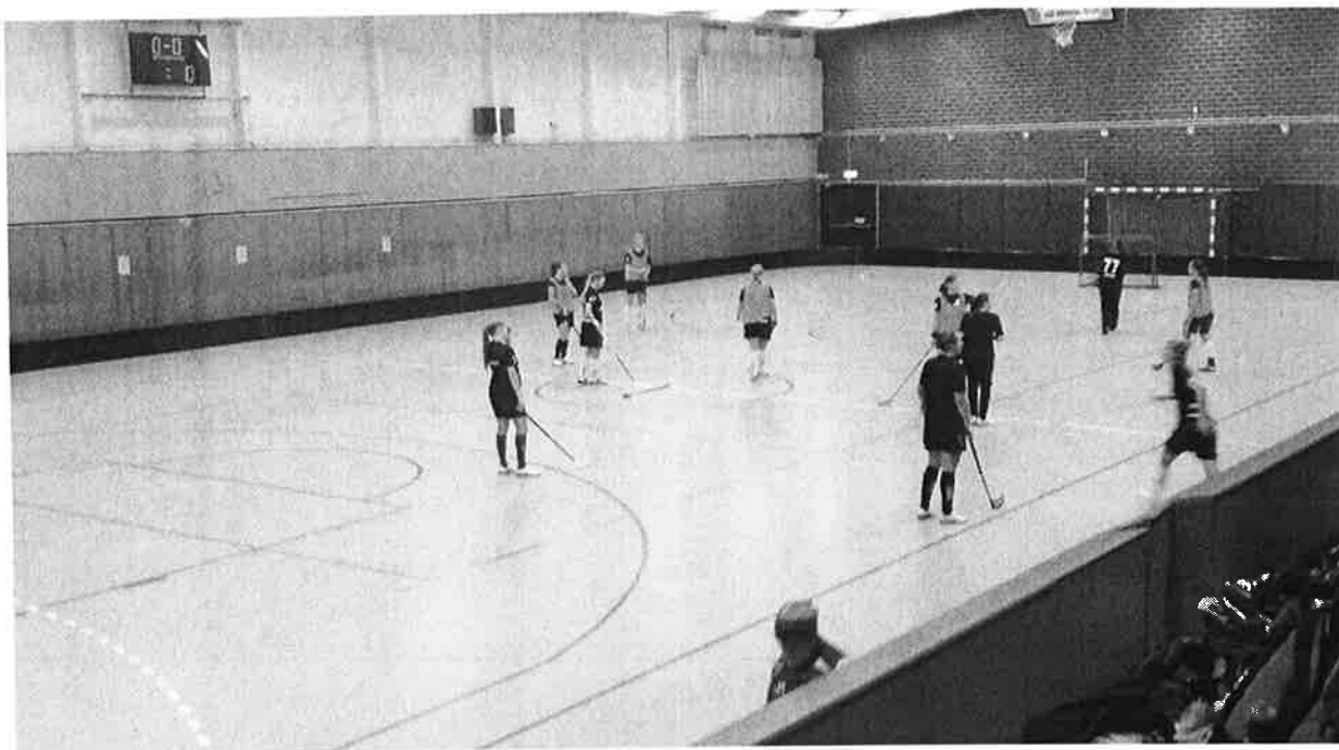
Bild 2: Västertorpshallen 20:20. Älvsjö AIK innebandy. A-lag damer?