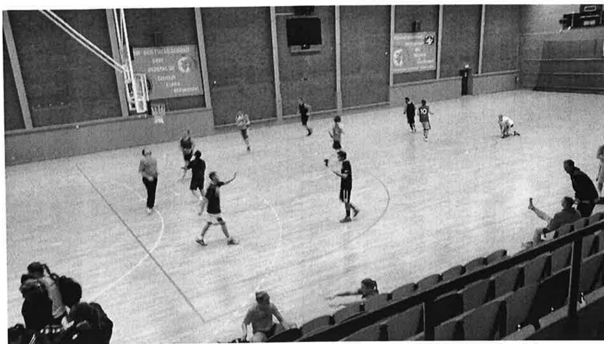
Bild 3: Brännkyrkahallen 20:35. KFUM Central Basket. A-lag herrar?