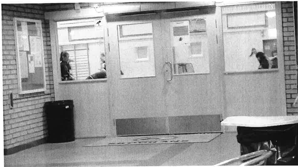
Bild 5: Sköndalshallen 20:50. Sköndals IK Innebandy. A-lag damer?