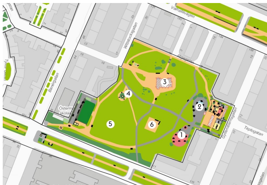
Kartan med de platser som diskuterades under dialogen med barn från parken.

För att få del av de mindre barnens syn på parken gjordes i juli en dialogvandring i parken med två grupper barn. Vi stannade på sex olika platser i parken där barnen fick berätta vad de tyckte om varje plats och om de ville att något behövde förbättras där. De fick också varsin karta att sätta gröna, gula eller röda pluppar på beroende på om de tyckte platsen var ”bra”, ”sådär”, eller ”dålig”. Allra bäst tyckte de om ”bouleytan” där de spelar bollspel. Många önskade nya mål, sarger och konstgräs där. Barnen tyckte minst om platsen omkring minnesstenen som man uppfattade som mörk och dyster. Flera barn ansåg också att slitaget var högt i parken.