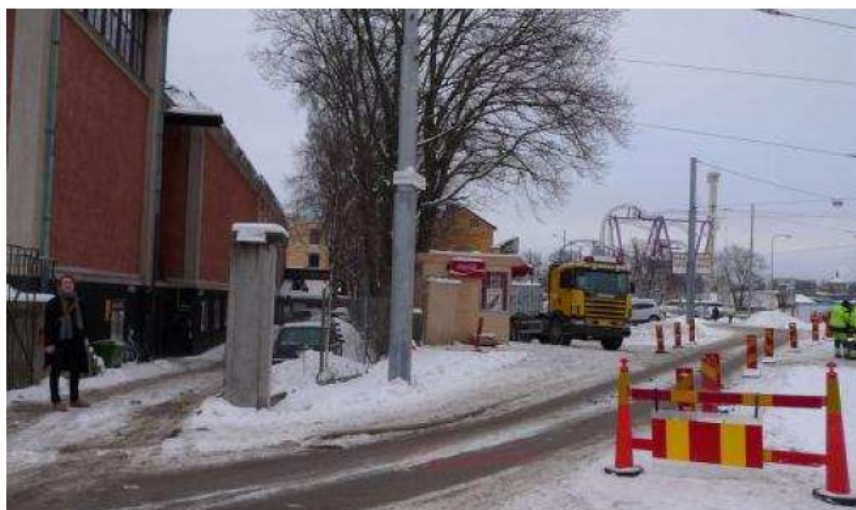
Vy vid Falkenbergsgatan, plats för tillbyggnad.

Även Blå Portens restaurang moderniseras och inryms delvis i tillbyggnaden. Idéer finns att utveckla platsen norr om den nya konsthallen till ett skulpturtorg. Placeringen av tillbyggnaden medför att den befintliga konsthallen fortfarande kommer att vara huvudnumret mot Djurgårdsvägen och Arkärret. Mot Falkenbergsgatan skapas i den nya utställningshallen en kompletterande entré. Det är meningen att tillbyggnaden i höjd och volym får ett släktskap med den befintliga konsthallen, men samtidigt ges en egen identitet med en särpräglad arkitektur.