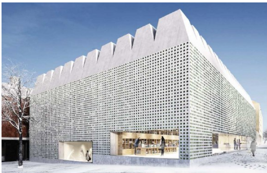
Föreslagen bebyggelse, fasad mot nordväst.

Den planerade konsthallen har en ljus betongfasad perforerad av glas och en karakteristisk takutformning som genom lanterniner skapar överljus till den övre utställningsvåningen. I söder förläggs den nya hallen 2,5 meter från fastighetsgräns på befintligt servitutsområde. Den gränd som skapas ska ge utrymme för in- och urlastning för Abbamuseet/hotellet, Blå Portens kök och Stadsholmens bostadshus. Möjligheten att ta delar av servitutsområdet i anspråk prövas under planprocessen. Mot Alkärret i norr finns möjligheter för en mindre platsbildning, t ex ett skulpturtorg. Så länge spåren till spårvagnshallarna vid Alkärret/Falkenbergsgatan kvarligg bedömer kontoret att fordonstrafiken behöver snedda över torget i likhet med idag.