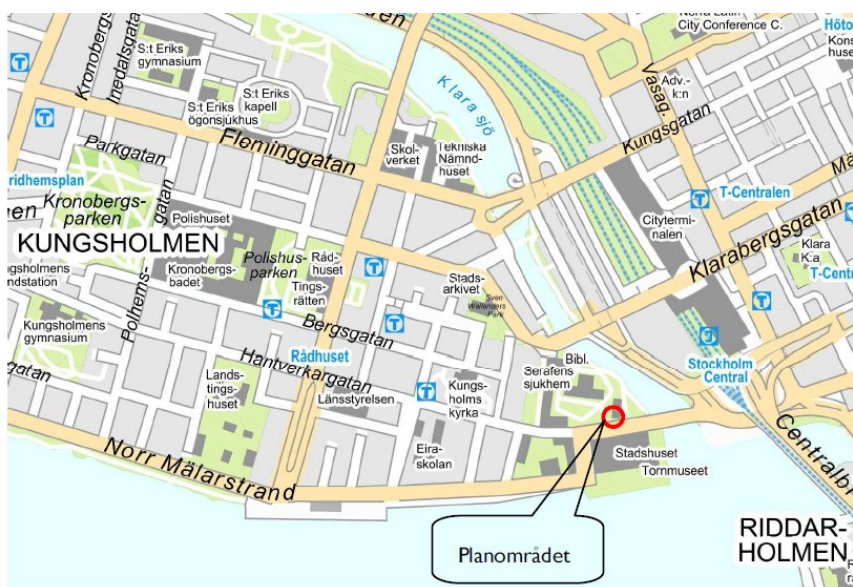
Planområdet markerat med röd ring.

Syftet med planen är att ge byggrätt och göra det möjligt för befintlig kioskverksamhet att finnas kvar på platsen då nuvarande detaljplan anger område som inte får bebyggas, och kiosken är för stor för att bedömas som planenlig.