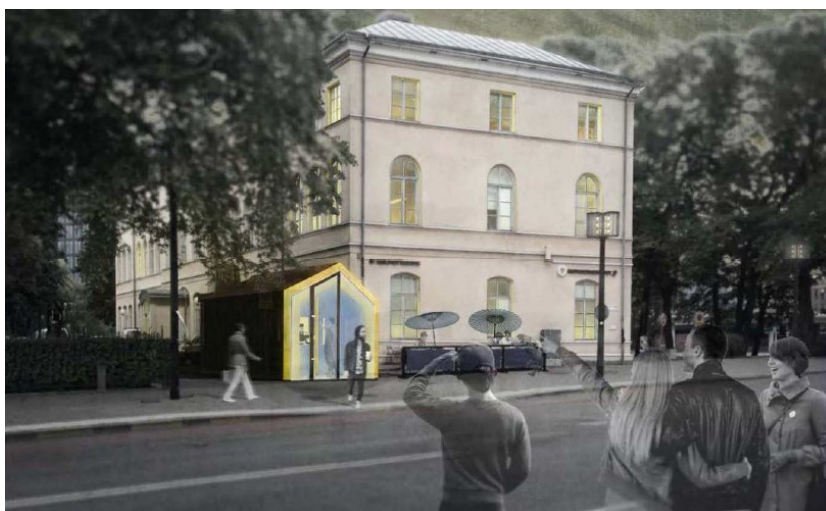
Föreslagsskiss på ny kiosk. Vy från Hantverkargatan.

Planförslaget innebär att nuvarande markanvändning föreslås ändras till handelsändamål där kioskbyggnad får uppföras i en våning med en största byggnadsarea av 25 kvadratmeter. Till kiosken hör också en uteservering (trädäck med staket) med ett mindre antal sittplatser.