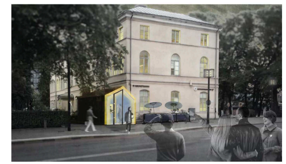
Föreslagen ny kioskbyggnad

Planen är upprättad enligt plan- och bygglagen (PBL 2010:900) med tillämpning av enkelt förfarande.