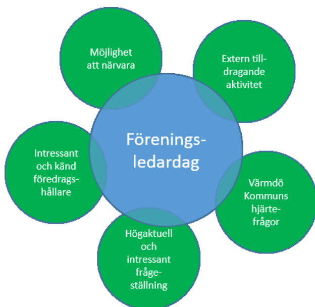
Figur 3 - Attraktiv föreningsledardag

Fem faktorer i förslaget, Föreningsledardag, bedöms vara särskilt viktiga för föreningarnas vilja att delta och därmed uppnå ett högt deltagarantal. Se illustration nedan