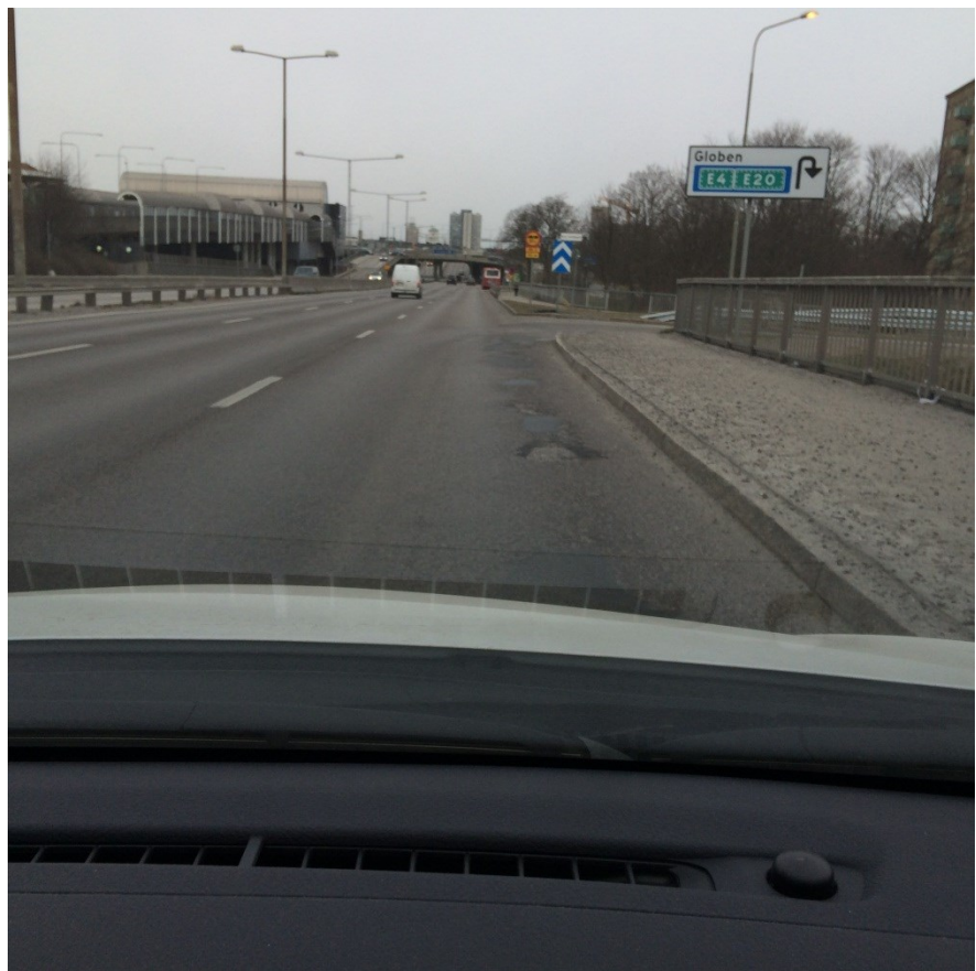
Exempel på sliten beläggning med ”potthålslagningar”.

Dessa vägar är mycket högtrafikerade med hög belastning från såväl personbilar som tunga fordon vilket gör att vägen slits ner fort. Temperatursvängningar under den senaste vintern har påskyndat slitaget. Antal inkomna skadeanspråk till trafikkontoret angående akuta skador i form av hålbildning i asfalten efter vintern ökar i takt med förslitningsskador.