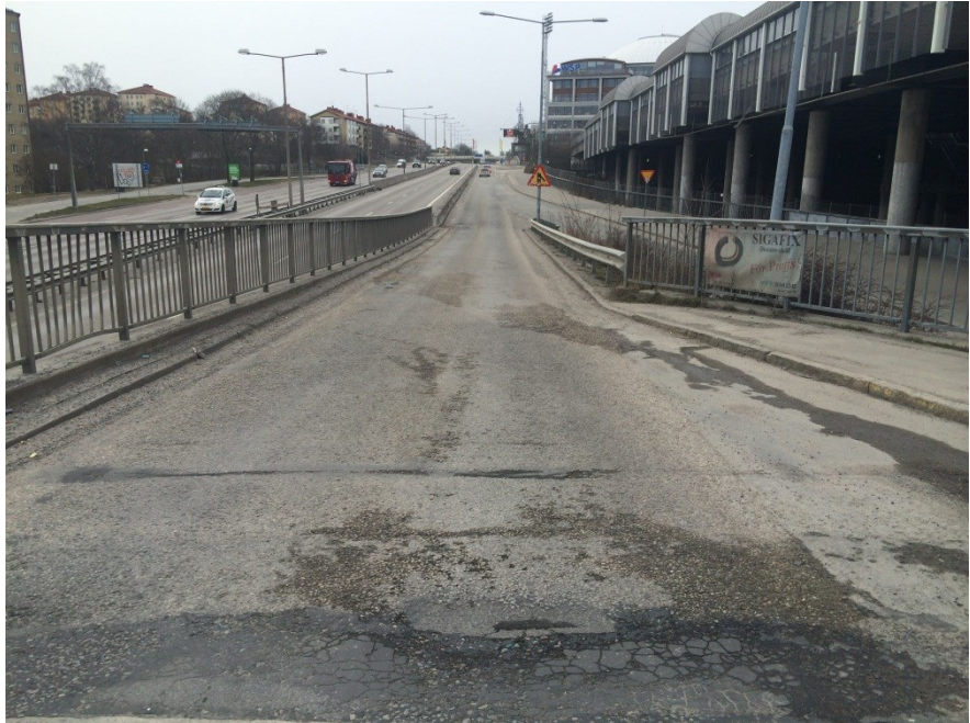
Exempel på sliten beläggning med sprickor och hjulspårsslitage.