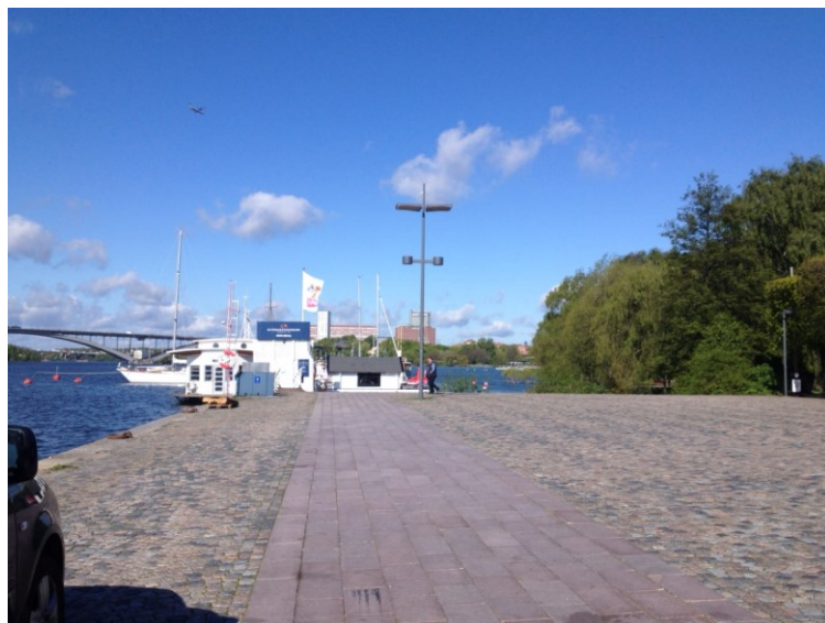
Kajen mot väster där en 195 kvm stor byggnad planeras.