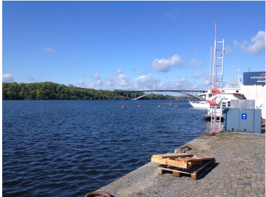
Vattenvyn mot Västerbron, föreslagen båtbrygga för gästhamn hamnar vid bojarna, övriga kajen möjliggör angöring för fartyg.