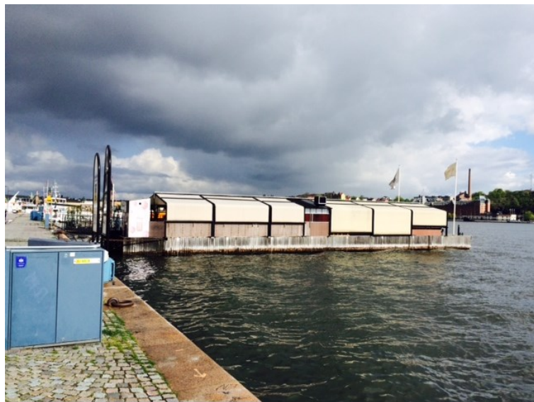
Ponton med restaurang som ges möjlighet till permanent förtöjning.