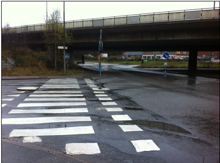
Stortorpsvägen anslutning före ombyggnad

Projektet har kunnat genomföras utan att stora avsteg har tagits från detaljprojekterad handling. Cykelbanan har på större delen av sträckan fått breddmått som följer cykelplanens standard och bättre trafiksäkerhet har kunnat uppnås genom att följa stadens riktlinjer för bland annat upphöjda övergångsställen eller mittrefuger på de platser där gatan fått en ny utformning.