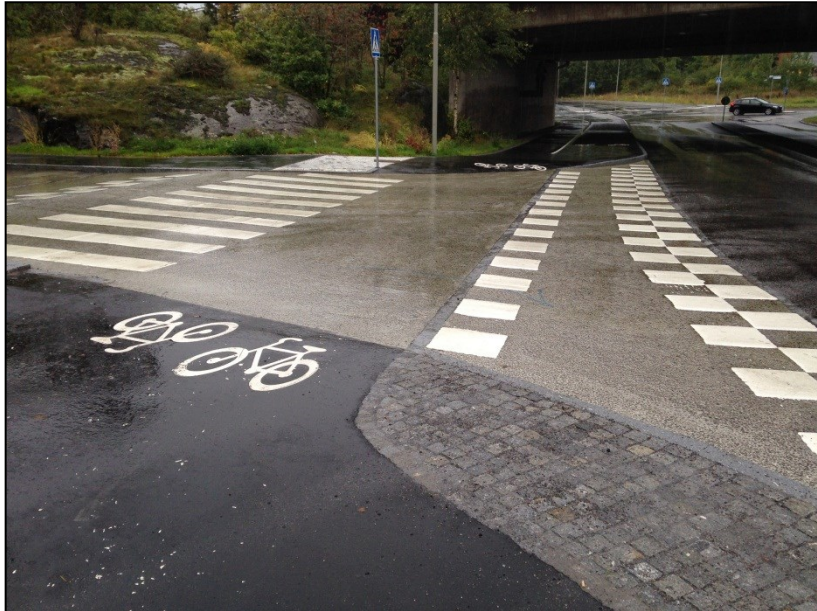
Stortorpsvägen anslutning efter ombyggnad