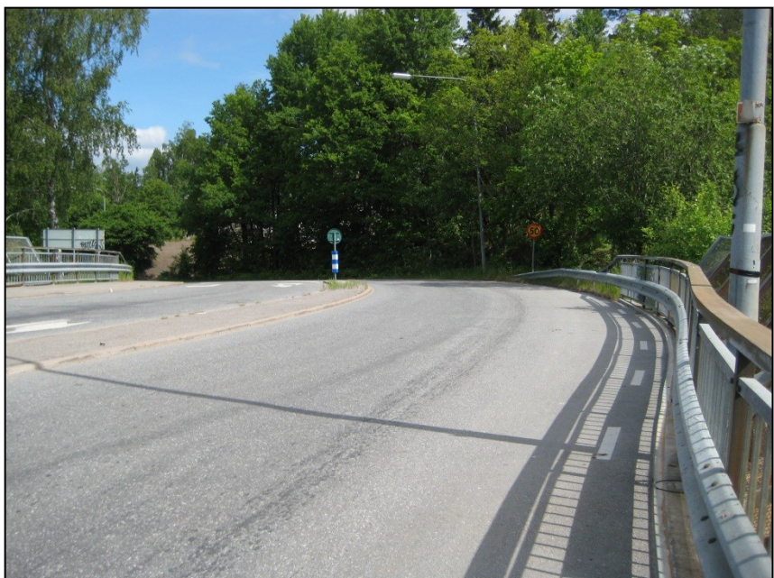
Pertorpsvägen på järnvägsbro före ombyggnad