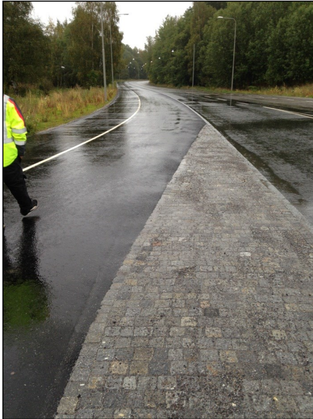
Längs med Pertorpsvägen efter ombyggnad