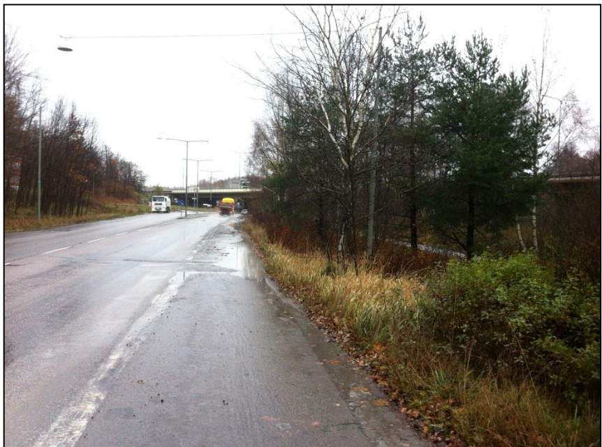
Längs med Pertorpsvägen före ombyggnad