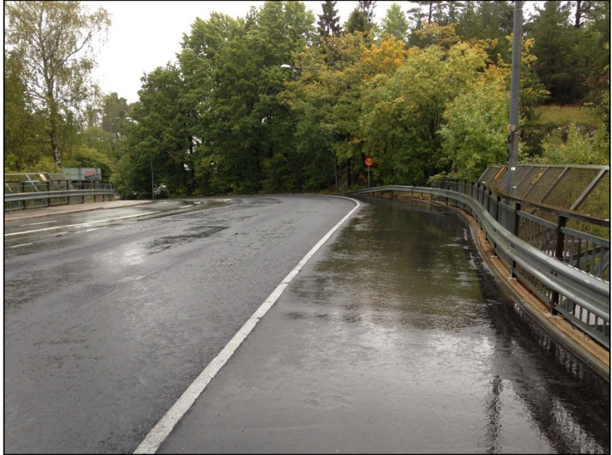
Perstorpsvägen på järnvägsbro efter ombyggnad