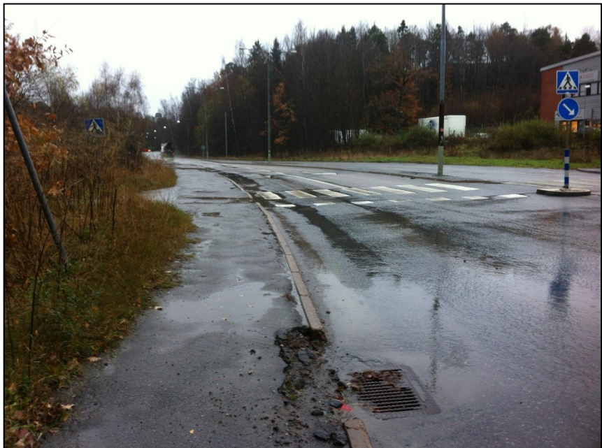
Längs med Pertorpsvägen före ombyggnad