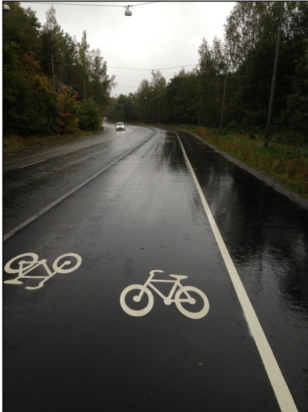
Längs med Pertorpsvägen efter ombyggnad