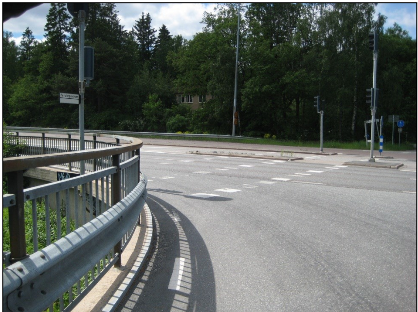
Pendelstråket över Magelungsvägen före ombyggnad