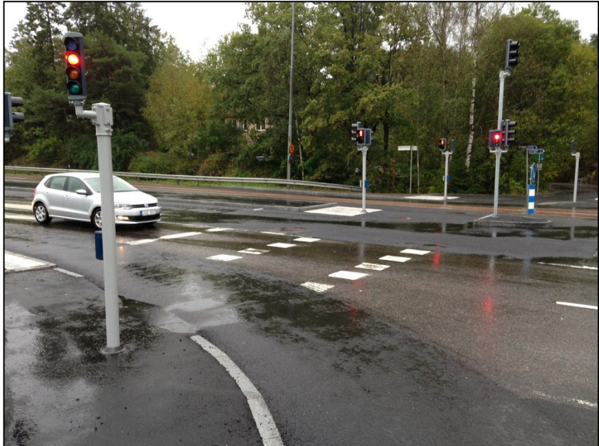
Pendelstråket över Magelungsvägen efter ombyggnad