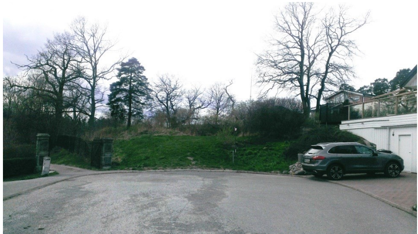
Parkområdet vid Nässelstigens vändplan.

Byggandet av en bro måste underställas miljödomsprövning. Med hänsyn till bronns längd och antalet stöd i vattnet så krävs tillstånd för vattenverksamhet.