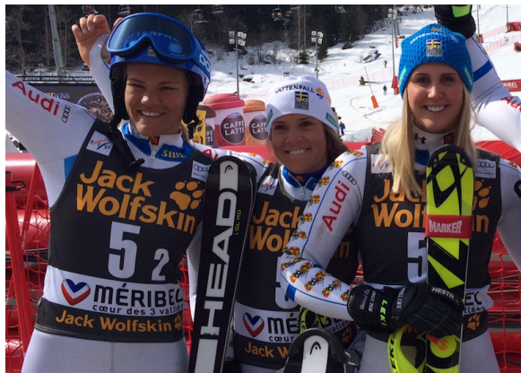
Exempel podium och prisutdelning