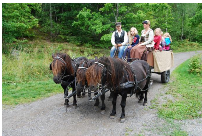
Slätter på Ablstorp

På Faluns naturskola – som också ligger organiserade under kultur- och fritidsnämnden – har man utvecklat ett samarbete med SFI där deltagarna fått göra praktik på gården. Ibland har det visat sig att de har kompetens att dela med sig av till verksamheten, att eleven blir läraren och tvärtom. Att hitta andra sätt att kommunicera än genom det talade språket kan vara en väg att knyta an eller hitta sin plats i samhället. I Falun hade man också en anställd slöjdare (före detta läns slöjds konsulent) som inom ramen för naturskolan arbetade med ungdomar som hamnat i utanförskap. Han arbetade med slöjd och samtal som metod. Genom hantverket kommer ungdomarna ner i tempo, blir närvarande och öppnar upp sig. På Rosendals trädgårdar arbetar man på ett liknande sätt med ungdomar som får baka stenugnseldat bröd och odla. På Uddby gård finns förutsättningar att arbeta för integrering och mot utanförskap med bakning, odling, hantverk och djurskötsel.