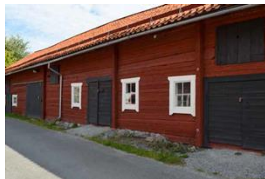
Längan ligger mitt emot kaféet

Ett rum i byggnaden Längan iordningställs som inomhusklassrum och förråd för naturskolan enligt skissen nedan. Detta utrymme kan också användas som möteslokal för föredrag, kurser med mera. Museets samling ägs av bröderna Magnusson. Samlingen har byggts upp under lång tid och består av huvudsakligen föremål med anknytning till Tyresös gårdar och torp. Ägandeförhållandet behöver redas ut för att göra samlingen tillgänglig för allmänheten.