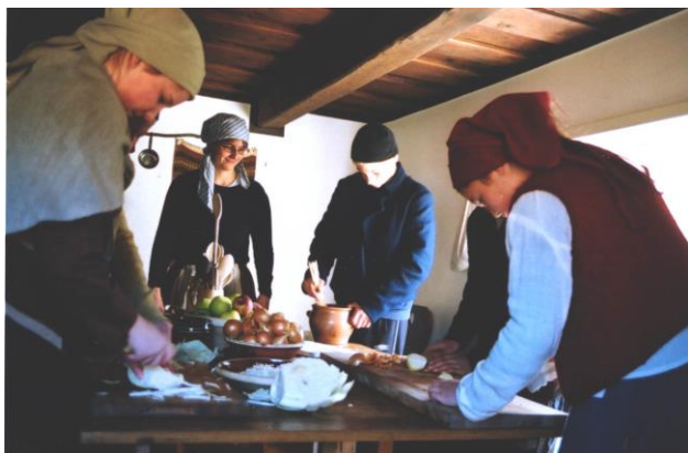
Bild från programmet Båtsman bråttom, en tidsresa till 1600-talet

Ahlstorp är en värdefull kulturhistorisk miljö som har en viktig roll i området och i kommunen. Här kan man ta fram en skötselplan som syftar till att återställa torpmiljön på ett pietetsfullt sätt och öka tillgängligheten. Utvecklingen bör ske i dialog med hembygdsföreningen. Ahlstorp används redan idag som bas för Naturskolans klimatema för åk9. Varje år i augusti genomför kulturavdelningen en slåtter av Ängen, något som utvecklats till ett uppskattat program som har stora kultur- och naturvärden. Miljön är också lämplig för kulturpedagogiska program, såsom tidsresor. År 2003 hade kulturenheten programmet Båtsman Bråttom där åk5 fick resa till 1600-talet.