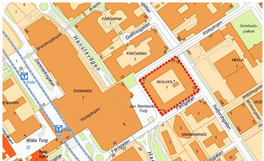
Markanvisningsområdet markeraerat med röd streckad linje

Nämnden beslutade 2015-05-21 om markanvisning för 2000 bostäder på IBM:s tomträtt Odde 1 i Kista. Utav de 2000 anvisade bostäderna utgörs ca 1100 av bostadsrätter och ca 900 av hyresrätter.