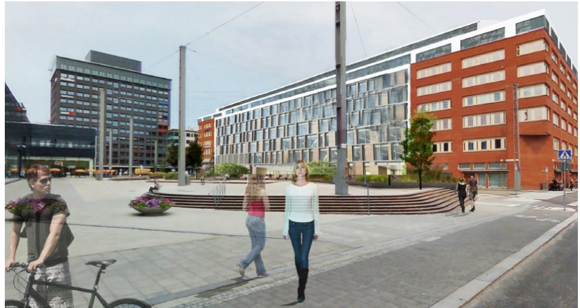
Illustrationsbild, Megaron Arkitekter.

Skisserna i förslaget visar i stora drag projektets utformning. Exploateringens innehåll och utformning kommer att prövas i planprocessen.