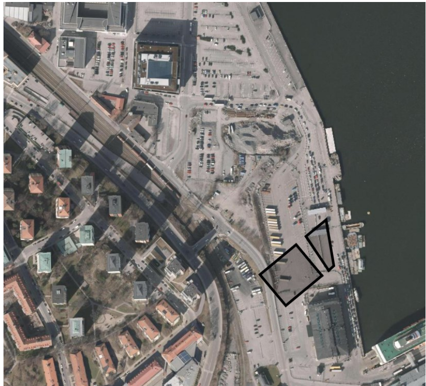
Ortofoto över områdena som utgör markanvisning för bostäder (t.v.) och kontor (t.h.).

Markanvisning sker enligt de principer som exploateringsnämnden angivit i sitt beslut om stadens markanvisningspolicy. Markanvisningen gäller under två år från nämndens beslut.