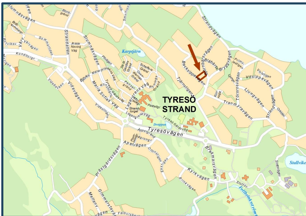
Karta med planområdet markerat i rött.