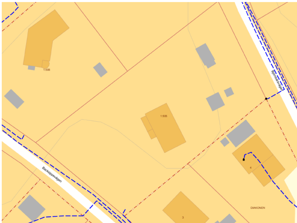
Bifogad karta till Vattenfall Eldistribution AB yttrande.

Befintliga elanläggningar måste hållas tillgängliga under alla skeden av plangenomförandet. Vattenfalls markförlagda kablar får inte byggas över och Vattenfalls anläggningar måste uppfylla det säkerhetsavstånd som framgår av Elsäkerhetsverkets starströmsföreskrifter.